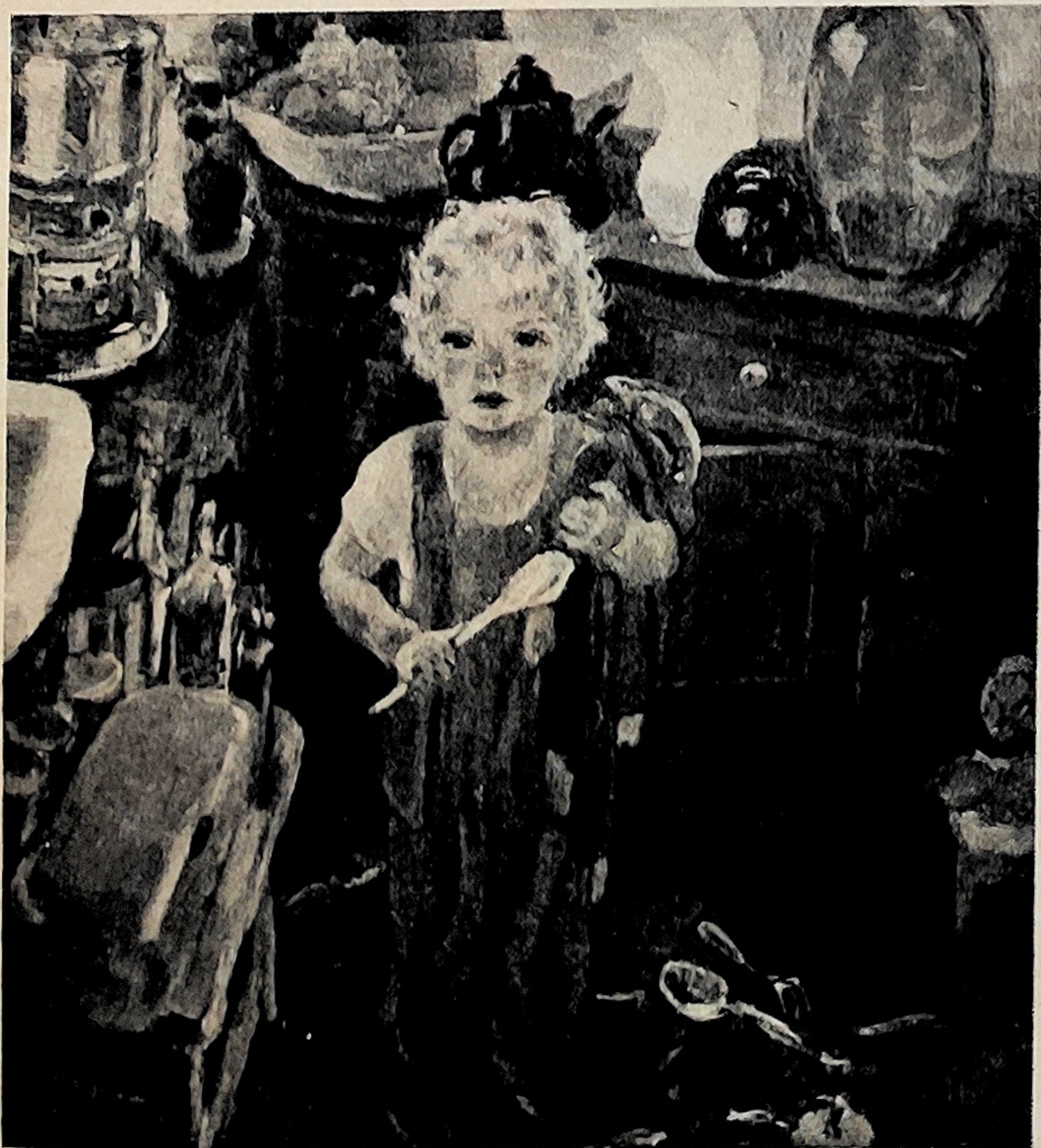
En dit is dan een schilderij, zoals Jan Sluyters herhaaldelijk gemaakt heeft. Met dit schilderij uit 1949 — het is zijn kleinzoon — heeft hij wel op bijzonder boeiende wijze het kind betraapt in zijn onbevangenheid.

voor was Sluyters, die zich om theorieën of programma's trouwens maar weinig bekommerde, te spontaan en te zelfstandig. En zo is het steeds gebeven. Hij volgde de ontwikkeling der kunst en deed overal aan mee, niet volgzaam, maar steeds vooraan, doch nam dan ook weer een overstapje.