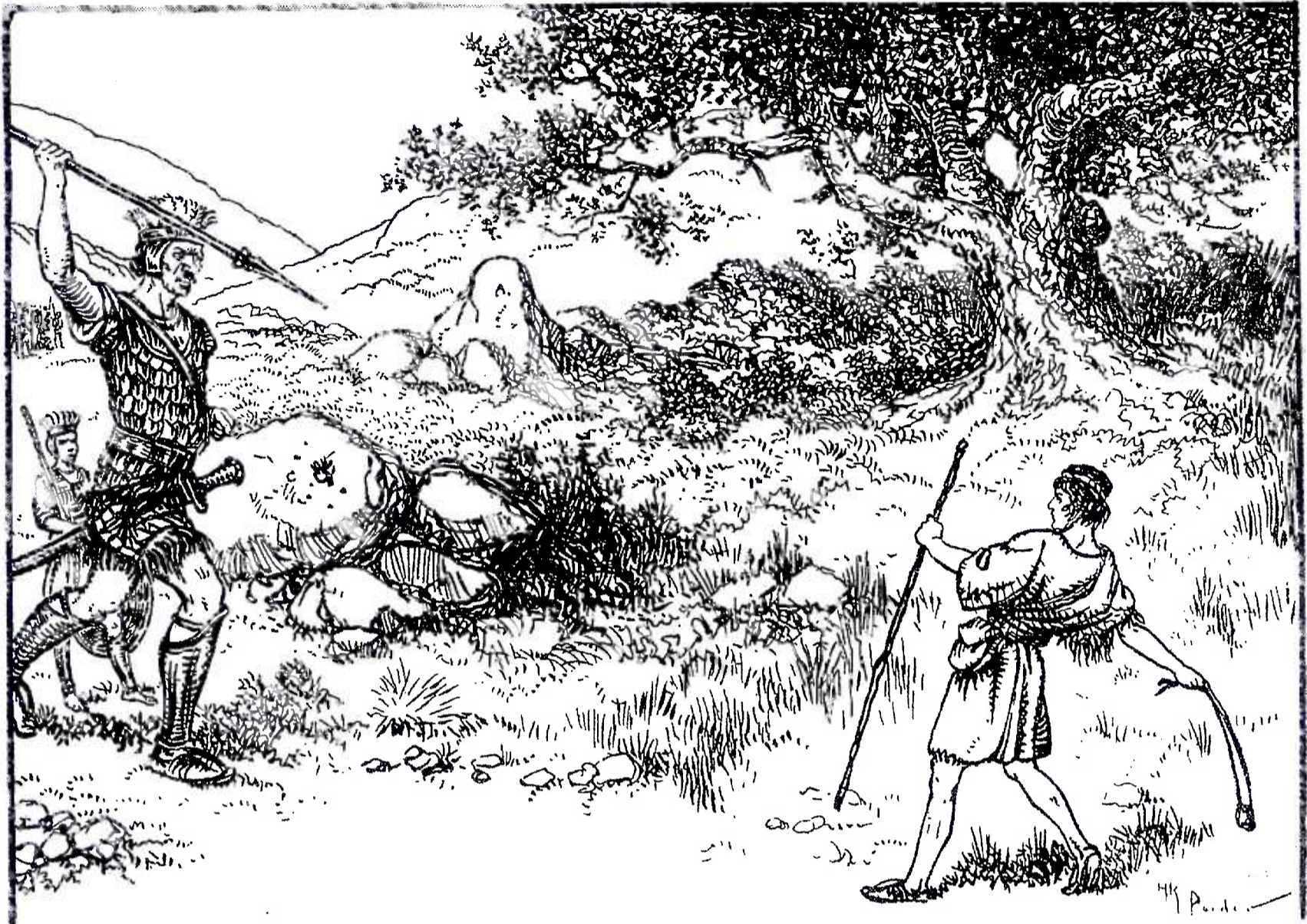
David en Goliath.