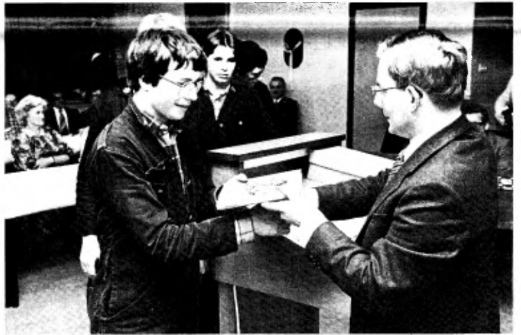
De uitgever overhandigt alle leden van de jeugd brandweer een exemplaar van het nieuwe boek van W. P. Balkenende.