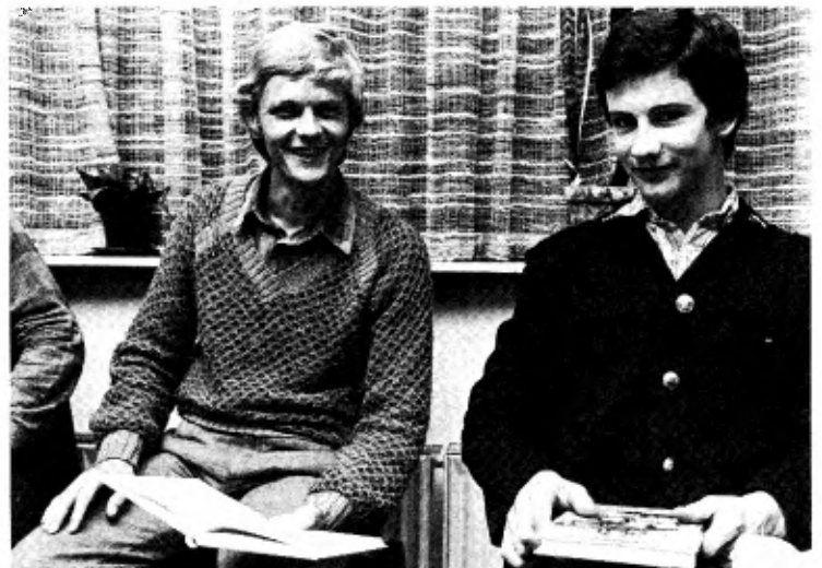
De tekenaar van de illustraties van dit nieuwe boek (links).