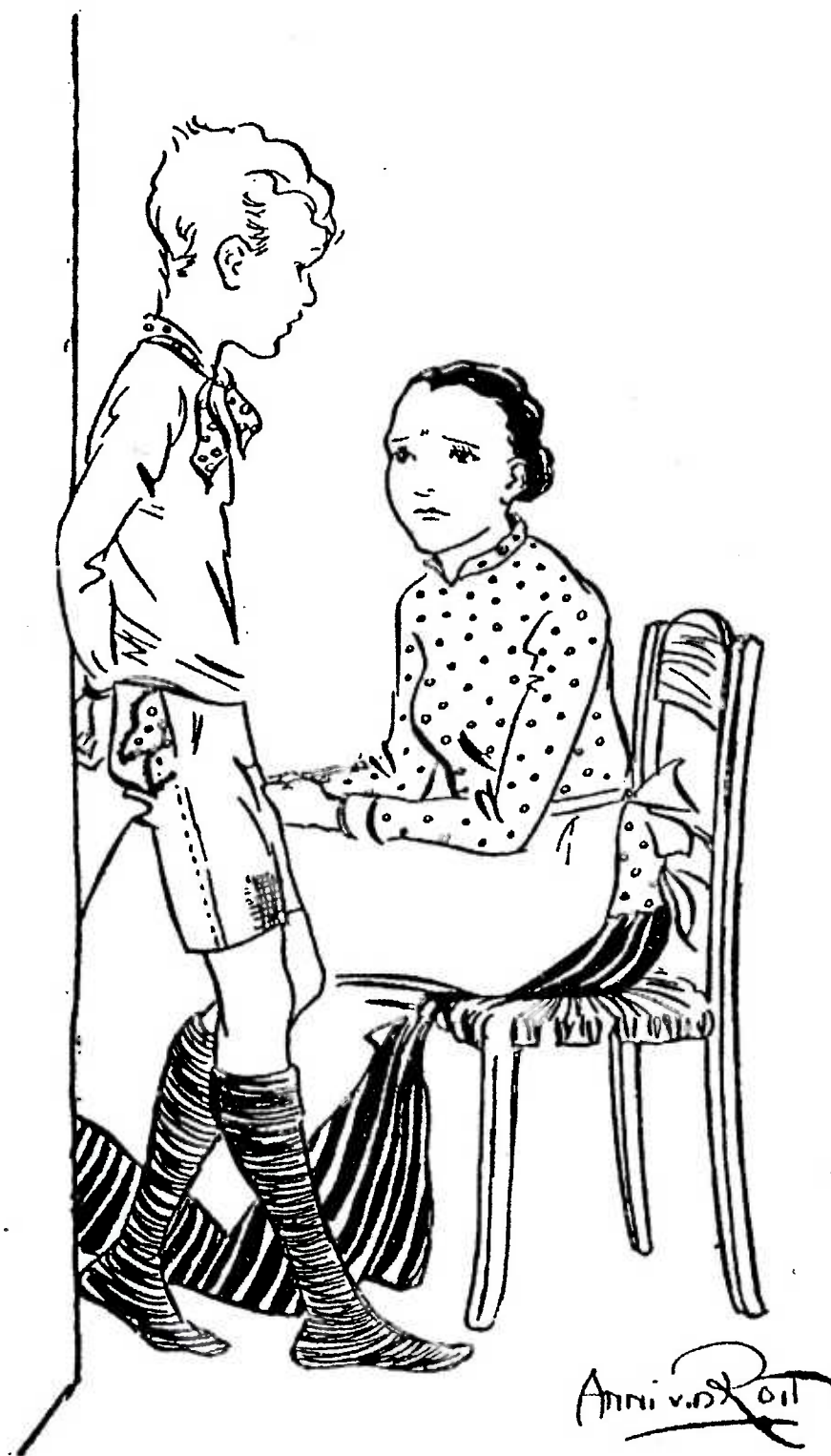
Maar moeder vroeg door.