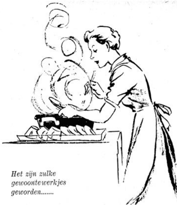
Het zijn zulke gewoontewerkjes geworden.....

Sfeer scheppen in ons eigen huis... het is ook een bovenmenselijk werk bijna. Nergens komt men