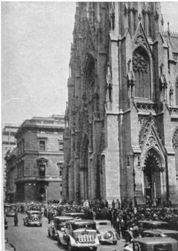
Parijs—Reims—München—Keulen...? Neen: de beroemde Fifth Avenue te New York, waar naast een wolkenkrabber een prachtige oude kerk verscholen ligt.