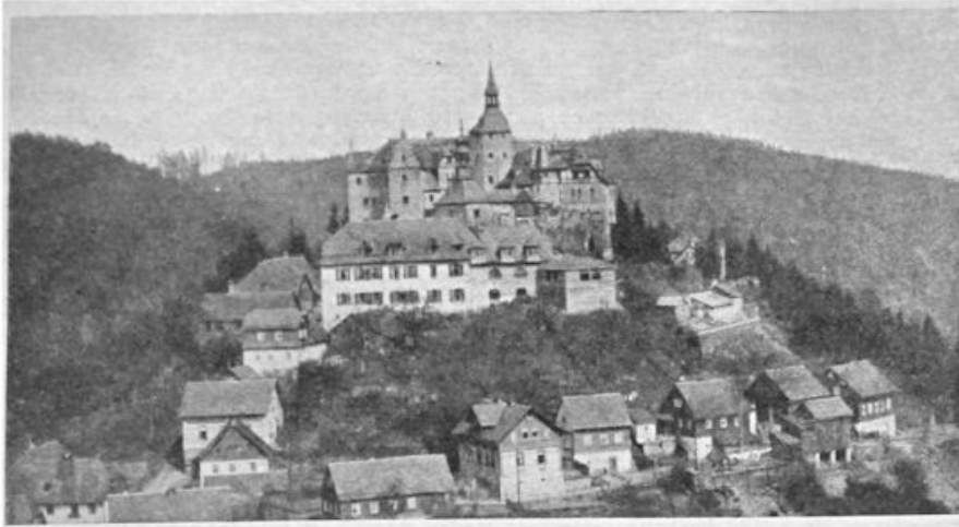
Het oude slot Lauenstein in Oberfranken, dat met den ondergang wordt bedreigd.

Met deze schoone vooruitzichten had Frerik Willem Oldhoes zich de laatste maanden geleid en bij voorbaat had hij reeds genoten met een groot vreugdig gevoel van al 't heerlijke, dat hij komende zag. Mei over een jaar!