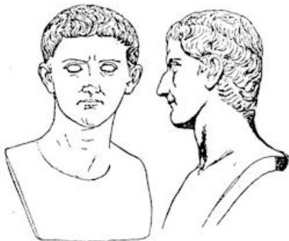
Keizer Tiberius (geb. 42 j. v. Chr., gest. 37 j. n. Chr.)

Titus-boog in Rome is deze triomftocht afgebeeld. De verwoesting van Jeruzalem sloot een tijdperk van groote vernedering voor het oodsche nationale bewustzijn af en maakte voor goed een eind aan het zelfstandige volksbestaan.