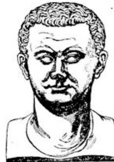
Keizer Titus (40—81 n. Chr.)

Augustus de opdracht Judea en Samaria bij het keizerrijk in te lijven, en onder een procurator of stadhouder te plaatsen. Deze stadhouder moest te Caesarea, aan de zee, zijn zetel hebben en het land door Romeinsche soldaten in bedwang houden. Copenius, de eerste procurator, legde een klein garnizoen in den burcht Antonia, ten N.W. van den tempel, en kwam alleen op de groote feestdagen naar Jeruzalem, terwijl