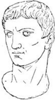
Keizer Augustus (geb. 63 j. v. Chr., gest. 14 j. n. Chr.)

Pilatus regeerde ruim 10 jaar; toen werd hij, wegens een door de Samaritanen tegen hem ingebrachte klacht bij den keizer ontboden. Hij stierf in het jaar 40, naar de overlevering wil, door eigen hand. In de jaren