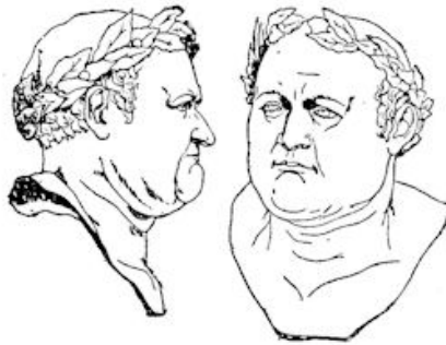
Keizer Vespasianus (9—79 j. n. Chr.)

die op Pilatus' dood volgden, scheen het, alsof Palestina weer onder de dynastie van een Herodes zou komen. Herodes Agrippa I, een kleinzoon van Herodes den Grooten, kreeg van keizer Claudius toestemming om, onder den titel van koning, over geheel Palestina te heerschen. Om zoo veel mogelijk bij de Joden in de gunst te komen, volgde hij nauwkeurig de voorschriften der Farizeërs op, deed vele offeranden en hield zich aan de wet van Mozes. Om nog meer de vriendschap der Joden te verkrijgen, wierp hij zich tot vervolger der Christenen op. Hij liet Johannes ter dood brengen en zou ook Petrus hebben omgebracht, als deze laatste niet op zoo wonderbaarlijke wijze uit de gevangenis was gered (Handelingen 12:1—20). Maar Palestina werd niet lang door hem bestuurd. Hij stierf in het jaar 44. Zijn verschrikkelijke dood is ons in Handelingen 12 beschreven.