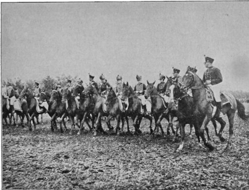
Groote historische quadrille van 1830, uitgevoerd door de bereden politie te Amsterdam en leden van de landelijke Rijvereening, op het jaarlijksche concours-hippique te Hooftdorp.

Hij ziet het, en moppert: „flauwe kul, da gegrien!”