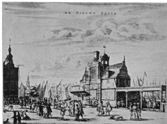
LINKS: Postjacht neemt de post over van zeeschepen. — RECHTS: Paalhuisje aan de Nieuwe brug te Amsterdam, waar de brieven afgegeven werden.