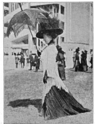
Hierbij een aantal wonderlijke modekiesjes! De drie eerste foto's hebben op de moderne mode betrekking en stellen voor de meest moderne costuums zooals die te zien waren, respectievelijk bij Engelsche, Fransche en Oostenrijksche Modeshows. Welke bezwaren men ook moge hebben tegen de vorige mode: deze was tenminste frisch en practisch, terwijl wat nu mode is o.i. smakeloos en onhygiënisch is, vooral door de lange rokken. Geheel rechts: hoe de mode twintig jaar geleden was. We gaan weer aardig dien kant uit!