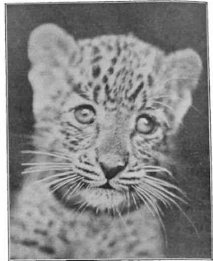
In den Rotterdamschen Dierentuin: een gevlekte zwarte jonge panter voor het eerst buiten, kijkt weemoedig naar den fotograaf.

Op 't onverwacht kreeg ze weer zware koorts, die haar toch al zwakke lichaam in korten tijd sloop-