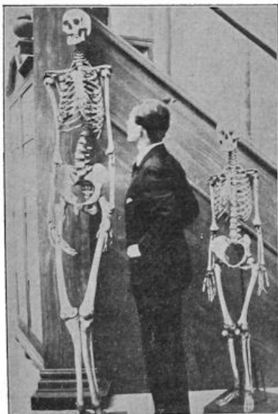
LINKS: Op eene tentoonstelling van Oud-Berlijn bevond zich de hierbij afgebeelde eigenaardige inzending: links een skelet van een der reuzensoldaten, van de gardesoldaten van den Pruisischen Koning, rechts een skelet van een normaal mensch. — RECHTS: De Hertog van Connaught inspecteert de voor onze begrippen wel wat wonderlijk aangekleede lijfgarde van St. James (Londen).

Zwijgen, dat had hij geleerd de jaren door. Al maar had hij z'n hoorders-tal zien slinken tot er op 't laatst Zondag aan Zondag alleen maar steeds 't zelfde stelletje plichtsgetrouwen zat, dat niet van „naloopen“ hield.