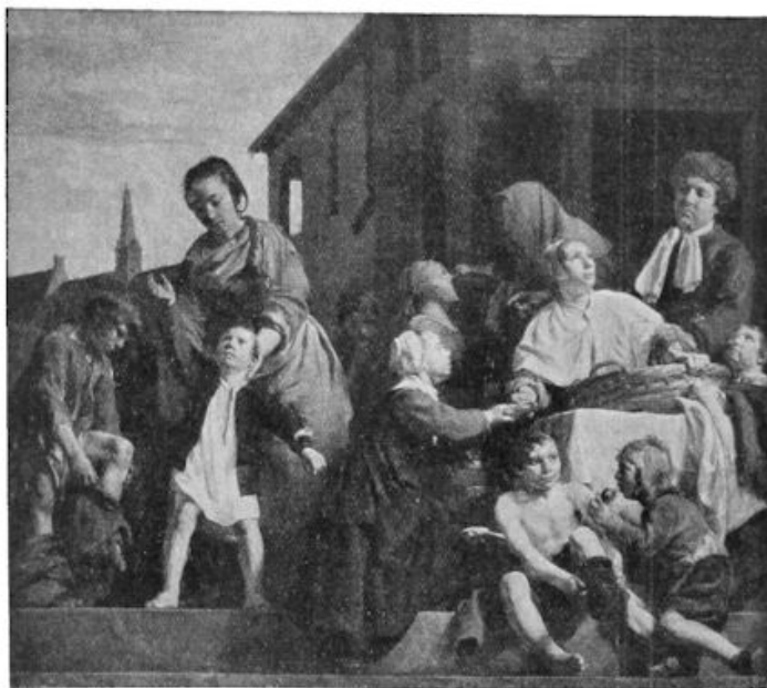
Het kleeden der Weezen in het Heilige Geesthuis.

En nu komen wij tot de instellingen van liefdadigheid, die ook