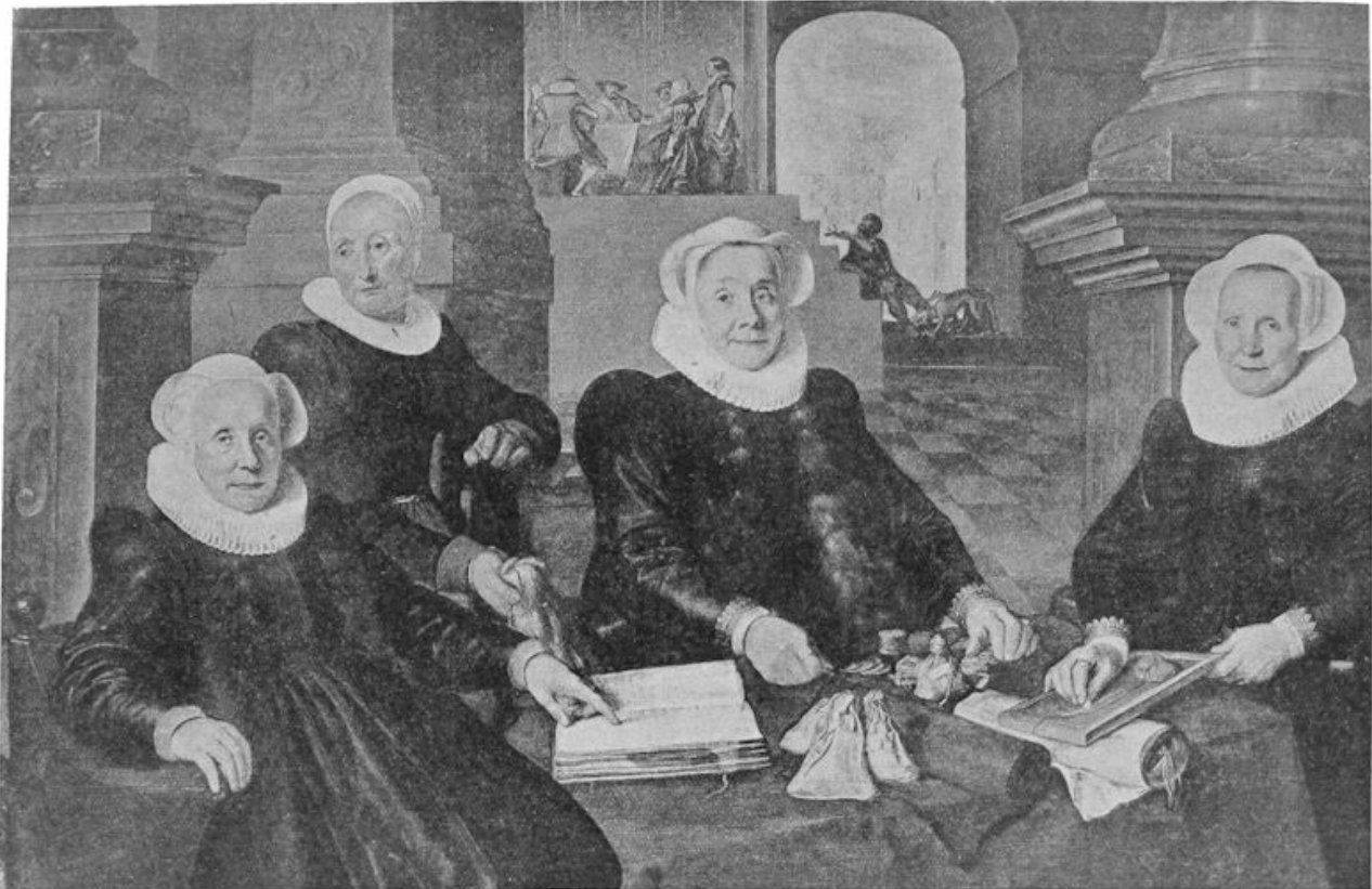
Drie regentessen en de binnenmoeder van het Leprozenhuis te Amsterdam.