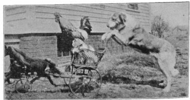
Een goeiefend stelletje!