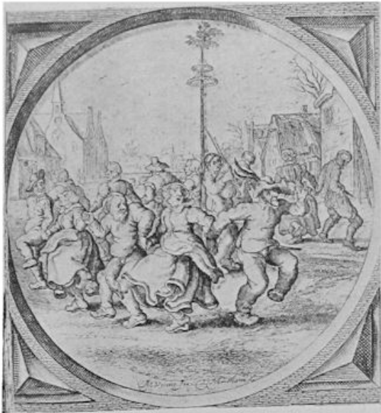
De Meiboom uit J. Cats' Spiegel van den Ouden en Nieuwen tijd.

Ostaria-Freya maar ook de gekerstende of Walburga verdrong den dienst van volksverbeelding kon de gedachte aan