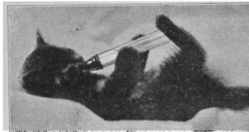
Bedien U zelf!