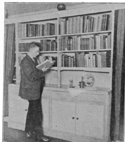
Een studeerkamerhoekje in het dezer dagen geopende nieuwe Studentenhuis te Utrecht.