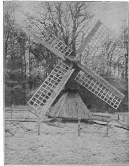
Een mooie watermolen, afkomstig uit Gorredijk (Fr.), in het Openlucht-museum te Arnhem.

RECHTS: De teekeningen op den wand van het zaaltje in den Pietersberg.