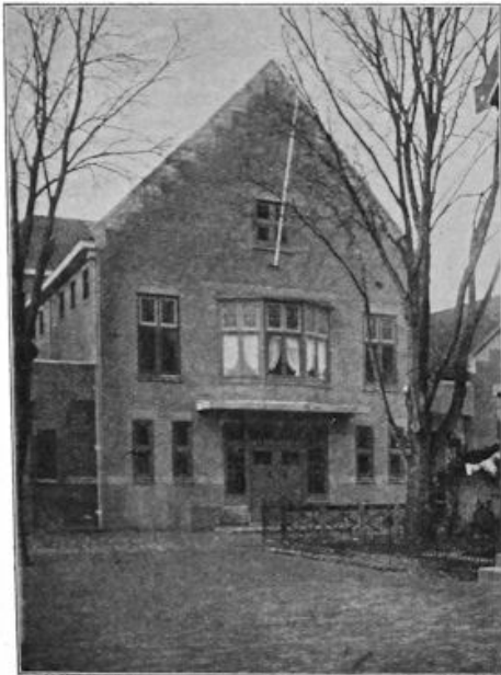
De mooie, pas verbouwde Chr. Nét. School te Broek op Langendijk (N.H.). Door de invoering van het 7e leerjaar was deze verbouwing noodzakelijk.

RECHTS: De Geref. Jongel. Vereeniging Pred. 12: 1a te Ouderkerk a. d. Amstel, vierde haar 25-jarig bestaan.