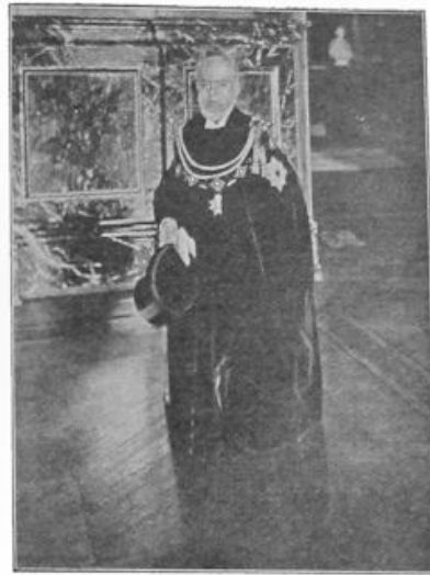
Een oude heer, in een nogal wonderlijk costume! Een portret van den kleinen Menzel, die een van Duitschlands beroemdste schilders was, in het gewaad van de orde van den Zwarten Adelaar. Menzel overleed vijf-en-twintig jaar geleden en de sterfdag van den kunstenaar zal in vele Deutsche steden worden herdacht.

RECHTS: Prinses Juliana woonde dezer dagen eene zitting bij van den Raad van State.