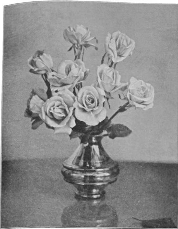
Rozen in den winter.