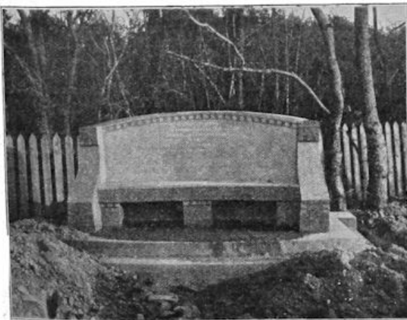
De De Génestet-bank te Bloemendaal, in welk plaatsje de dichter, over wien onze medewerker in dit artikel schrijft, gewoond heeft.

Als..... Bunyan eens kiezen mocht..... H. J. v. D. M.