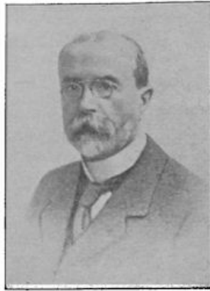
Mazarijk, de president van Tsjecho-Slowakije, zal weldra 80 jaar worden. Een groote campagne is aldaar in de pers geopend over de opvolging van den huidigen krassen Staatspresident.

regeling van het vraagstuk van de schadevergoedingen verkregen is. Wat de nieuwe overeenkomst vooral kenmerkt, is, dat zij niet meer berust op een dwang van de schuldeischers tegenover de schuldenaren, doch in zekere mate op de vereeniging van hun belangen. Het vraagstuk van de schadevergoedingen — zoo heeft Minister Loucheur het uitgedrukt — gaat van het politieke naar het commercieele terrein over. Daar is het inderdaad veiliger. En zoo kan men zeggen, dat de Haagsche Conferentie heeft meegewerkt tot bestendiging van den wereldvrede. Bij de slotzittingen ging het zooals het wel op een markt pleegt toe te gaan. De koopman zegt, dat het artikel zooveel kost. De kooper antwoordt, dat dit hem veel te duur is. Dan houdt de koopman vol, dat de kooper een onwaarheid zegt. Heeft hij er wel rekening mee gehouden wat 'n zorg en een moeite er noodig is geweest om het