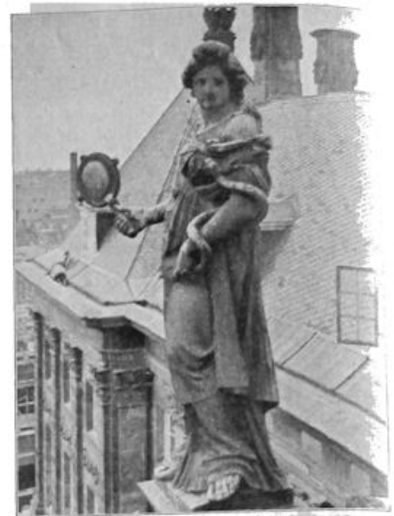
Een der beelden op het Koninklijk Paleis te Amsterdam, voorstellende de Voorzichtigheid.

Ook in anderen zin is Noord-Holland arm geweest en gebleven. In ondernemingslust en -kracht sterk, en daardoor levende voor den handel en het handelsverkeer met overzeesche landen, hadden de Noord-Hollanders van vroeger tijden niets over voor en waren zij evenmin minnaars van de kunst. Op een in 1874 gehou-