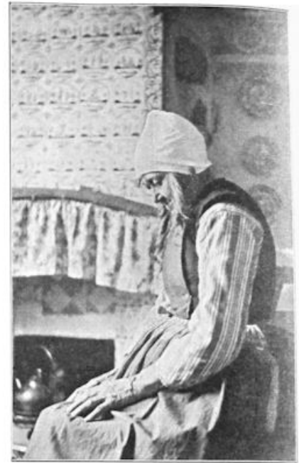
Marker-vrouw in haar mooie antieke kamer.

Zoo is N.-Holland een bron van welvaart geworden, 2795 K.M². in oppervlakte, waarvan 48 pCt. grasland en 25 pCt. bouwland en tuingrond. De bevolking is dan ook sterk toegenomen, (afgezien van den uiteraard grooten trek naar de hoofdstad), tusschen 1830 en 1920 met 213 pCt. Centra der welvaart zijn