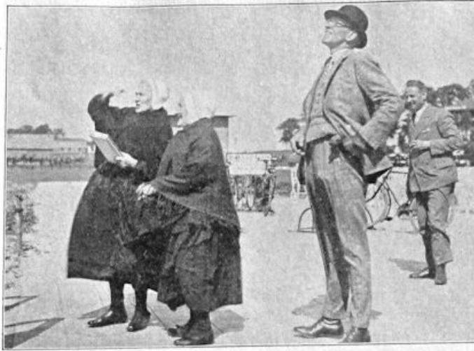
LITGAANS DAGJES voor ouden van dagen te Amsterdam. Eenige oudjes bezichtigen met grote belangstelling de vlieghaven Schiphol.