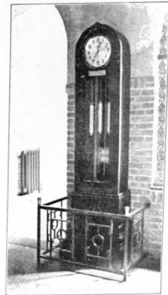
BOVEN: De prachtige klok, een geschenk der oud-leerlingen.