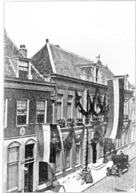
BOVEN: De versiering aan het gebouw d. Theol. School.