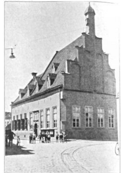
Stadhuis te Doesburg.

En nu Amor in Gelderland. Die was vooral in actie in den Pinksternacht. De jongelingen namelijk maakten dan uit, welke meisjes een strooman verdienden. In optocht ging men, met den snaak van het dorp boven op een kar, te middernacht op weg. Waar een „in aanmerking komend” meisje woonde, werd een pop in een boom, op het dak of in den hooiberg gedeponeed. Dat hielp: een volgend jaar waren de meisjes meestal wel wat gedweeër tot vrijen. En wie dan een vrijster aan den haak sloeg, genoot van een