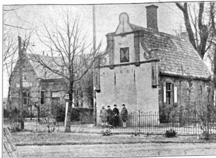
HET OUDE HUIS TE SCHIEDAMSCHEN DIJK staat in den weg van de moderne verkeersverkeer en wordt gedacht aan te worden afgevoerd en verroling naar een goede plaats.

„Nou, dat is toch wat Juffrouw”, zei Wim op zoo'n diep meewarigen toon, dat ze er zelfs, niettegenstaande al haar zorg, toch even om moest glimlachen. „Maar, zeg me nu eerst maar eens, hoe of jij het wel maakt.....”