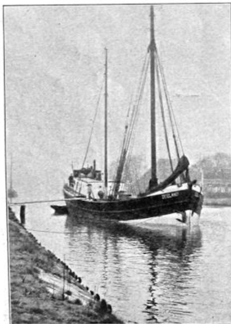
LINKS: Dezer dagen is het Nederlandse motorschip „Zeeland” met een lading cement van Londen via IJmuiden in de Alkmaarsche haven aangekomen, alwaar de lading wordt gelost. Dat een zeeschip opstoot naar Alkmaar behoort zeker wel tot de zeldzaamheden.

„Wim, weet je wel, dat jij met je sterke geloof en je blijmoedige hart tot een voorbeeld bent?”