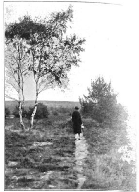
Aan den boschrand.

Maar nu een gansch andere kant van de Overijsselsche folklore, die trouwens nog in eere is. Dat is een der frappantste plattelandsgebruiken: het midwinterblazen. Dat geschiedt met „t meedeweenterhoorn”, een zeer lange bazuin ongeveer, waarop de boeren buitenshuis een monotoon gecgec laten hooren; de langé uithalen eischen zekere virtuositeit en men heeft dan ook in dit musiceeren baas boven baas en er zijn „manks lu, die er zoo moar wat um toe bloast”. Er komt heel wat oefening aan te pas; er