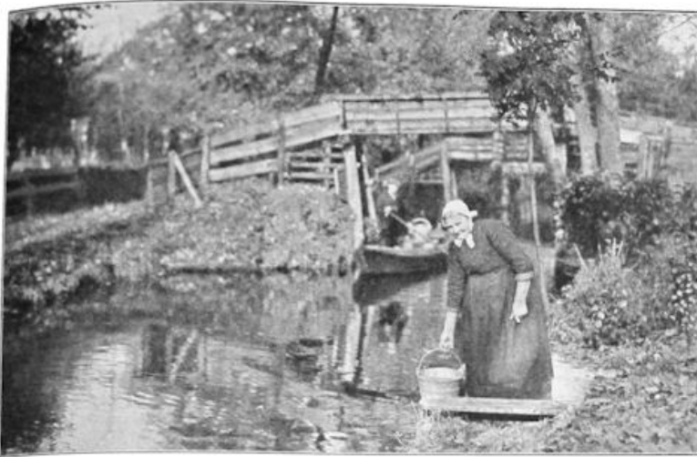
IN GIETHOORN. Oud vrouwtje speerpunten en..... scheermessen.

Maar laten we liever boven den grond blijven, want er is in het Overijssel van heden nog genoeg te zien. Het heeft bovendien nog toekomst-mogelijkheden van beteekenis. Men denke slechts aan het groote Twentsche kanalenplan, dat nu eindelijk de uitvoering nadert. (In November van dit jaar kan men het 10-jarig bestaan vieren van de Wet, door beide Kamers met algem. stemmen aangenomen en die dus een voorbeeld is van het trage tempo, waarin de parlementaire en departementale molens plegen te malen.) En dan ook denke men aan de drooglegging der Zuiderzee, die Kampen en het Kamper eiland (5300 H.A. puik grasland ter waarde van 12 miljoen gulden) nieuwe perspectieven opent in verband met de IJsselmeer-polders. Wie de kaart van het Twentsche kanalenplan vergelijkt met de oude kaarten, door Jacobus van Deventer voor Karel V gemaakt, kan zich indenken, met hoe groote verkeersmoelijkheden Twente te tobben had. Twente is arm aan water. Oldenzaal bijv. kreeg zijn koopmansgoederen te water over de Almeloosche Aa; van Dulder af brachten Dulder boeren ze per wagen naar de stad. Enschede had een voorhaven bij Enter; de goederen gingen van daar per wagen over den Deldenschen dijk.