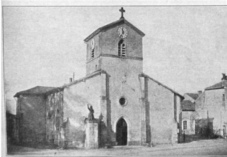
LINKS: de kleine Kerk te Domremy, waar Jeanne d'Arc engelenstemmen zou hebben vernomen. RECHTS: De poort te Vaucouleurs.