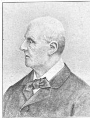
Bruckner in zijn tijd van roem.

Wij moeten Anton Bruckner dus leeren kennen uit zijn groote werken. Voor de concertzaal heeft Bruckner negen symphonieën en enkele groote koorwerken gecomponeerd en die werken behooren tot het allerbeste en allerschoonste wat er aan muziek geschreven is. Het zijn wel in het bijzonder de IV e , VII e en IX e symphonie, die tot de meest belangrijke werken der moderne concertzaal gerekend worden. Wat betreft de groote koorwerken, vinden wij op de concert-programma's vermeld: „het „Te Deum”, „Psalm 150”, „de