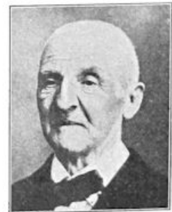
Op hoogen leeftijd.