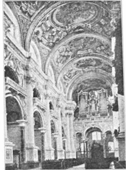
Kerk te Florian.