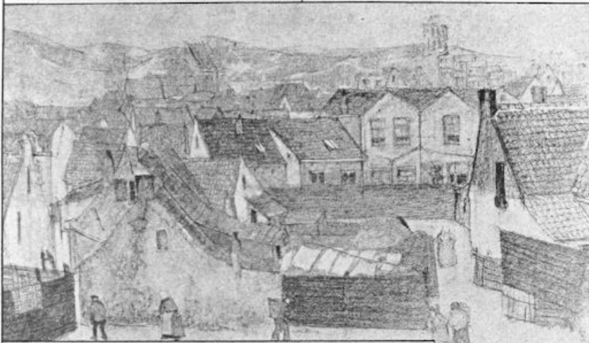
Gezicht op Egmond