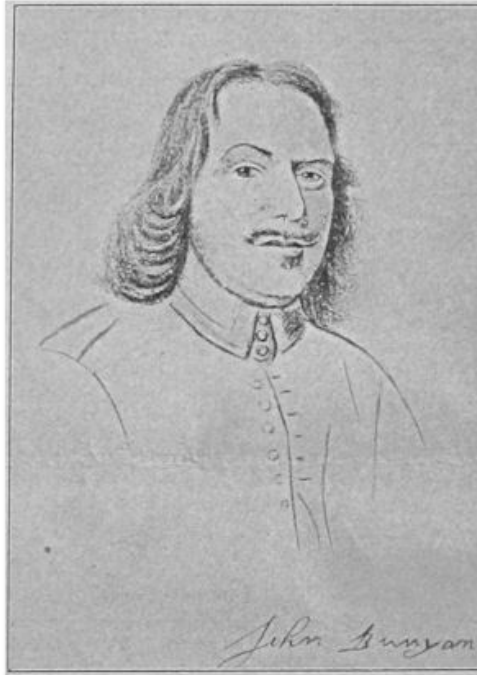
John Bunyan, naar eene teekening.