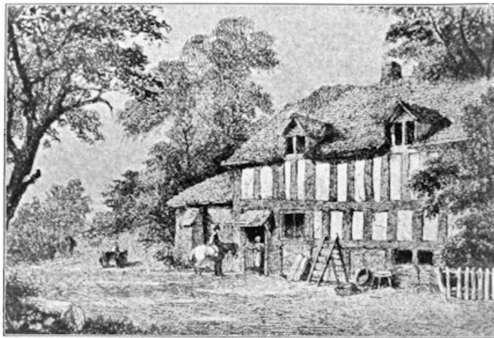
Bunyan's geboortehuis te Elstow.

Toen hij op het hoogtepunt van zijn roem stond, konden de kerkgebouwen de hoorders niet bevatten. Zelfs een van Oosterzee in ons land en een Frank Thomas in Zwitserland hebben het nooit zoover gebracht dat in den grauwen ochtendschemer een paar honderd menschen geduldig stonden te wachten totdat de deuren van het kerkgebouw opengingen! Zoo was het echter méér dan eens bij Bunyan. Hij was geliefd, maar — wie geliefd is, wordt ook gehaat. Het duurt niet lang of de officieele staatskerk, die dezen ongeordenden lekenprediker niet kon dulden, sluit Bunyan in een gevangenis op waar hij twaalf beste jaren van zijn leven in een gedwongen rust moest doorbrengen die lijnrecht inging tegen den onstuimigen vrijheidszin van zijn karakter. Deze kerker wordt hem echter een Pniël en een plaats van groote, geestelijke bevrijding. Zijn bekeering wordt hier voltooid en zijn geestelijk leven ontvangt er den diepgang dien wij blijvend in de „Christenreis naar de eeuwigheid" kunnen bewonderen.