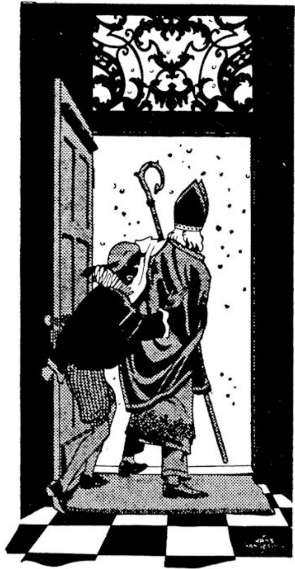
Als dieven sloopen zij de deur uit

Ze deed het masker af, ze duwde lachend een piek onder de muts. „Eenig was het!” zei ze, en terwijl hun stappen naast elkaar gingen, zag ze nog steeds warme, grijpende handjes, Pepi's oogen, ernstig, met een kuiltje boven zijn wenk-