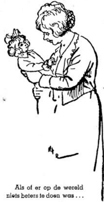
Als of er op de wereld niets beters te doen was ...

Een paar knipperende bange kinderogen in een weerstrevend opgetild gezichtje..... Sijtje wordt warm van medelijden.