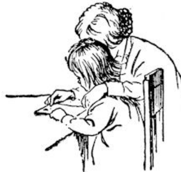
Haar arm glijdt om de schoudertjes.

„Ik heb 'n pòp,” zegt Sijtje langzaam, en haar bruine ogen glanzen even verukt als Fietje's grauwe. „Ik heb 'n pòp — En die heeft pòlka-haar. En die kan slàpen. En ze ligt in 'n wiég — met 'n nàchtpon aan. Met kàntjes.....”