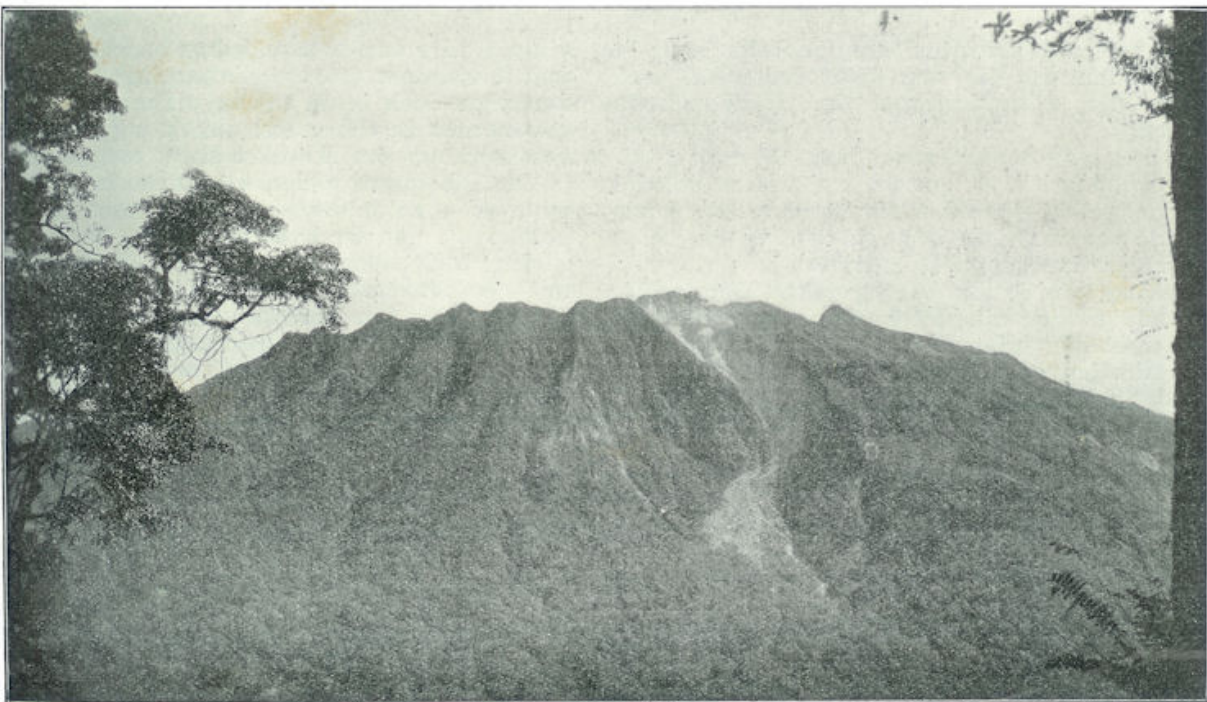
De ruige, geribde Sibajak.

Op Zaterdagmiddag vertrokken wij van Medan naar Berastagi, uit het lage land van Sumatra's Oostkust naar de Karo-Hoogvlakte. We zeggen dit nu zoo gemakkelijk en we gaan zoo