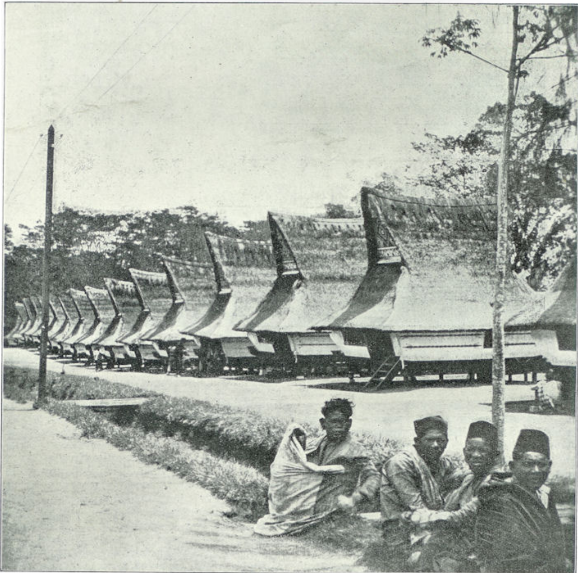
In het Leprozendorp, waar de Christelijke liefde wonderen van toewijding verricht.

en er wordt zeer kort gepreekt — want het is toch nog maar zoo'n jonge gemeente en de dienst heeft iets kinderlijks. Maar is de belofte niet toegezegd aan hen, die zullen zijn als de kinderen?