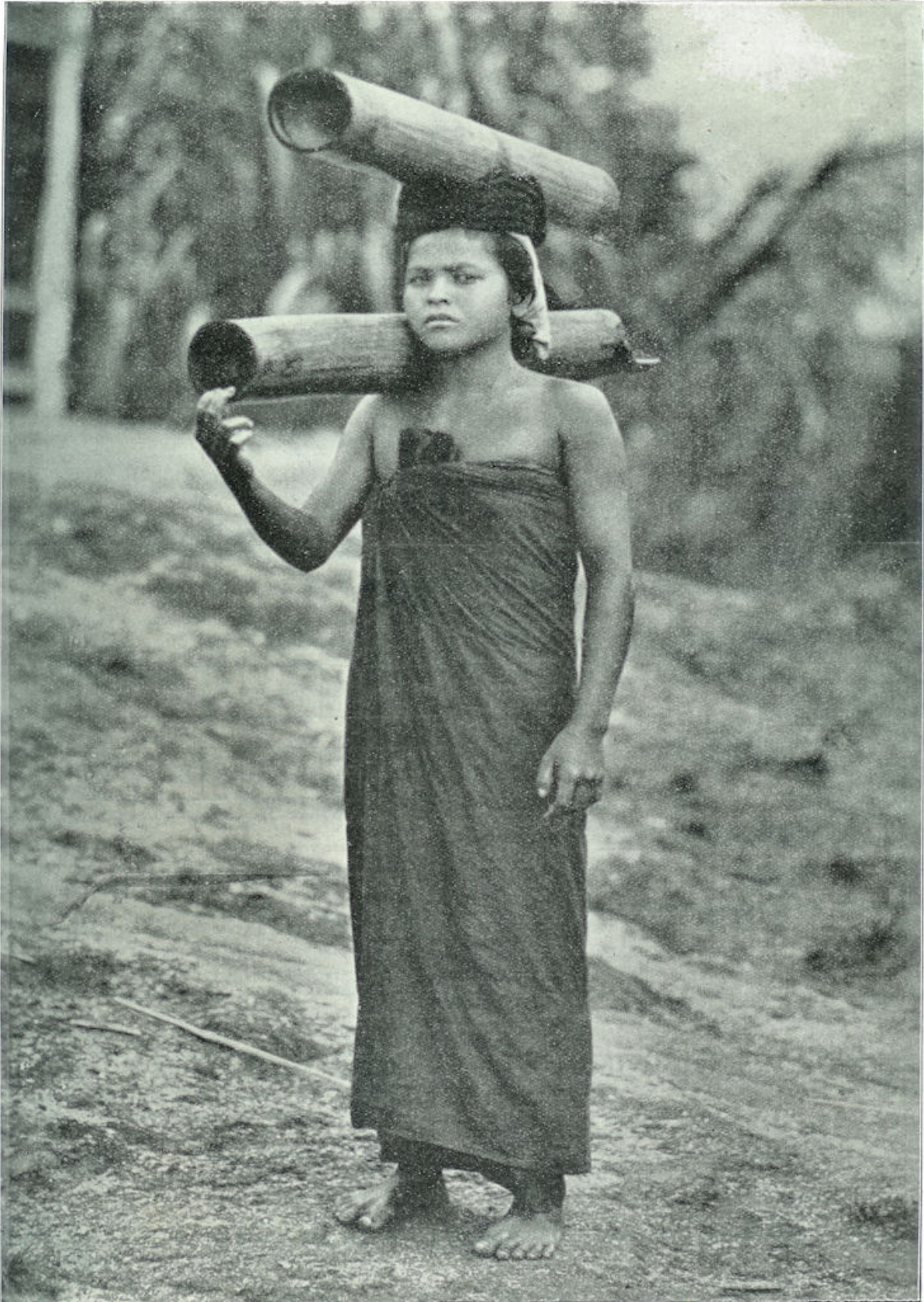
Een Battaksch meisje met bamboe-cylinders, waarin zij water haalt.