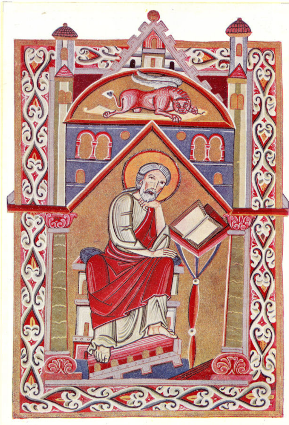
De Evangelist Markus, zoals hij is voorgesteld in een Evangelieboek, bewaard te Eichstätt, geschreven omstreeks 1080.

van rijk opgemaakte B's. De onze is uit een in Engeland omstreeks 1250 geschreven Psalter. Overigens is deze initialenversiering