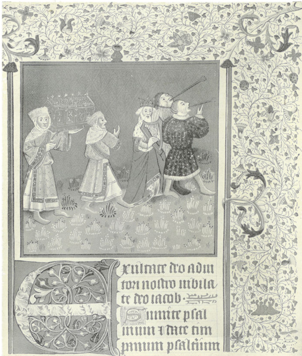
Miniatuur uit een Psalmboek, in Engeland geschreven omstreeks 1450. Ze geeft een schildering bij Ps. 81 van het opbrengen van de ark door David.

met zijn miniaturen was veroordeeld om te verdwijnen. Maar voor het verdwijnt, laat het zich nog eens zien op zijn schoonst. Althans ik voor mij acht de versieringen van deze Bijbels te behoren tot de allerbeste. Ze vereenigen ornament en illustratie. De miniatuur is met rand en tekst tot een prachtig geheel ge-