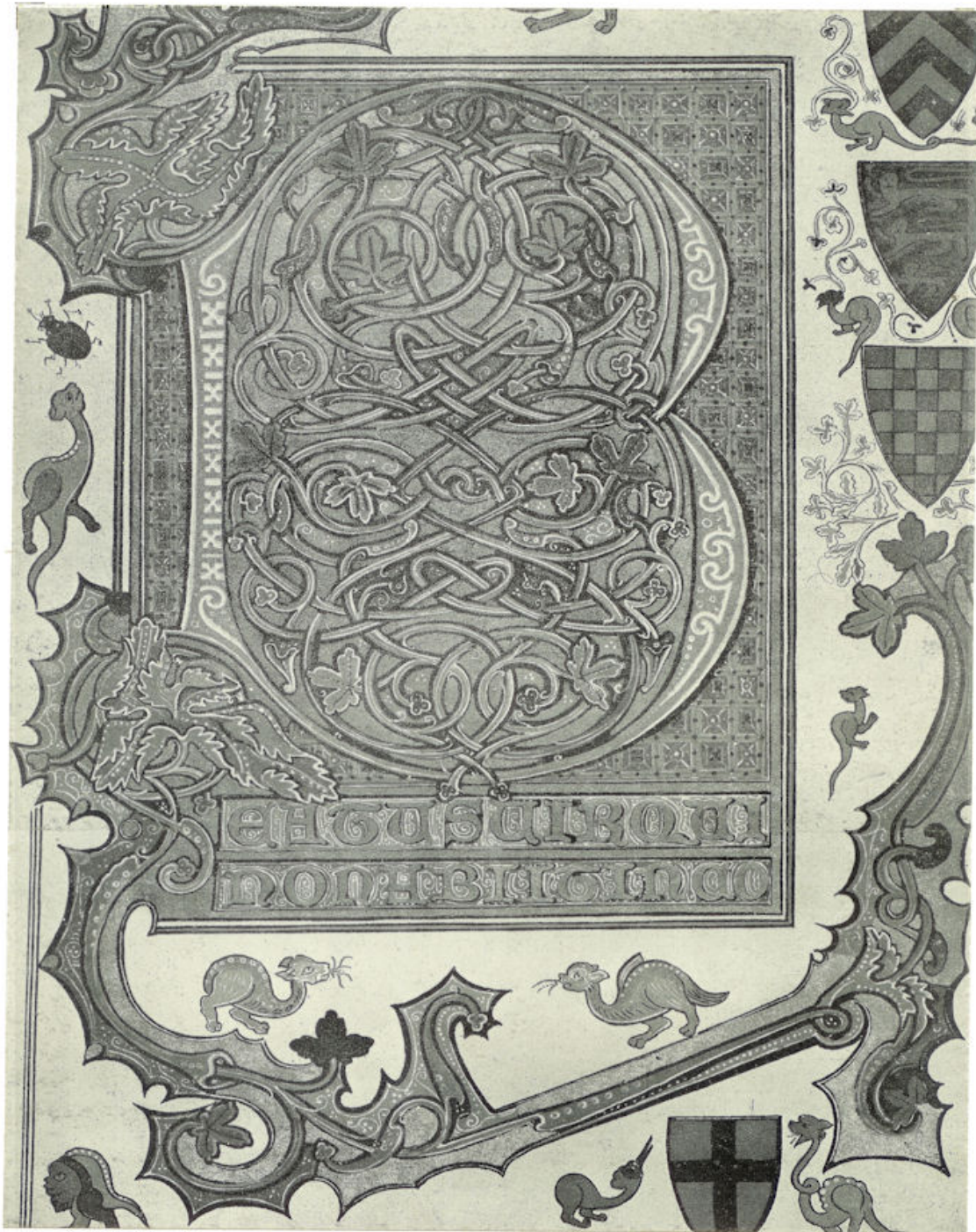
De B van Beatus, welgelukzalig, het eerste woord van het Latijnsche Psalmboek. Deze versierde initiaal is uit een in Engeland omstreeks 1250 geschreven Psalter.