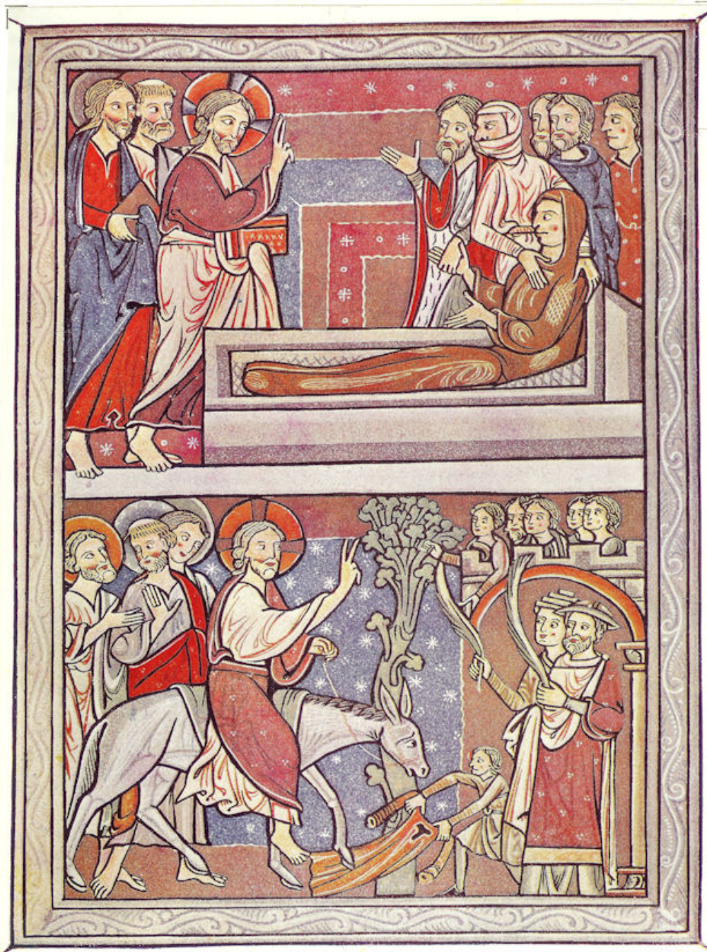
Boven: de genezing van Petrus' schoonmoeder; beneden: Jezus' intocht in Jeruzalem. Deze miniatuur, genomen uit een in Engeland geschreven psalmboek, dagteekent van \pm 1180.

ze staat daarmee in verband, dat de handschriften niet meer in enkel hoofdletters of initialen worden geschreven, maar in z.g. cursiefschrift, waarin hoofdletters en kleine letters afwisselen en de gelegenheid komt om bij-