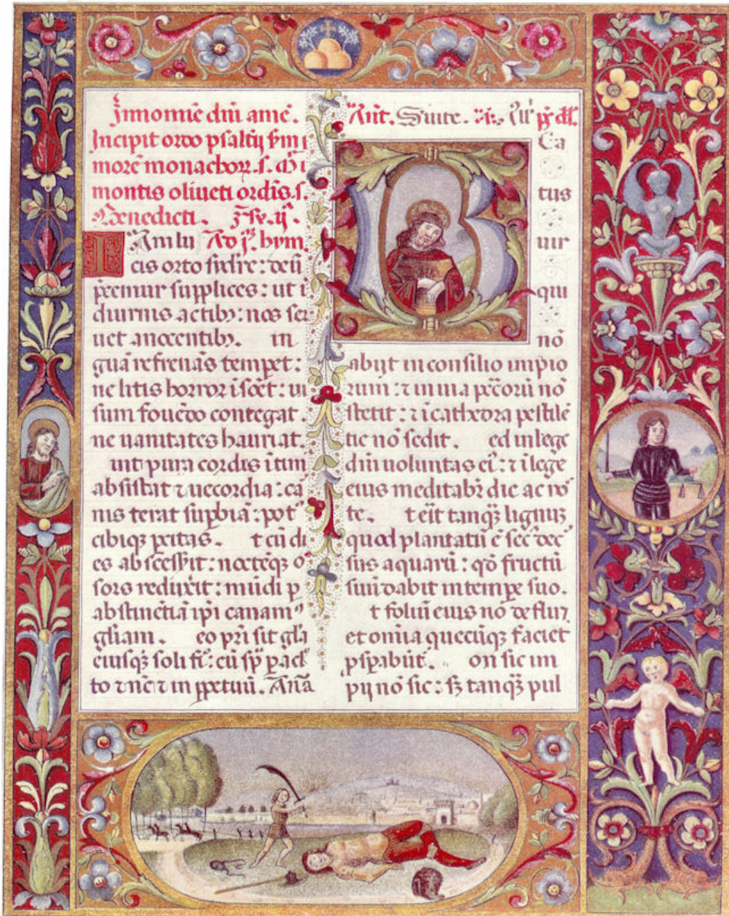
Miniauur uit een Psalmboek, in Italië geschreven omstreeks 1490. Beneden: Davids overwinning op Goliath.

van ± 1490. De eerste geeft bij Ps. 81 een schildering van het opbrengen van de ark door David, de tweede brengt bij het begin der Psalmen Davids overwinning op Goliath in beeld. Al het traditioneele en symbolische is overwonnen. Perspectief is aangebracht. Er is geteekend naar de natuur. We staan hier aan het begin van een nieuwen tijd.