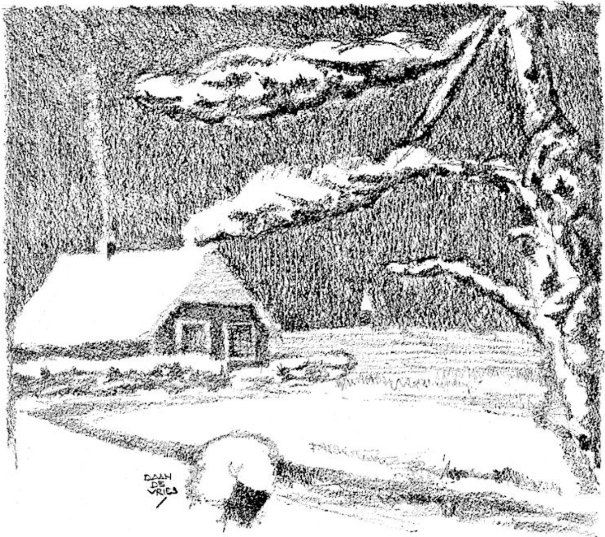
„De laatste Kerstmis.... Dat was met sneeuw....” (blz. 150).

gen we weer naar bed. 's Morgens om 8 uur stonden we op en gingen naar beneden om te ontbijten. Toen dat afgeloopen was, gingen we naar de zaal, waar het Kerststalletje stond en daarvoor begonnen wij te zingen van allerlei liederen. Daarna werd ons een mooi verhaal verteld en toen het 10 uur was gingen wij naar de parochie. De mis was om twaalf uur pas uit. Toen wij thuis kwamen stond het eten al klaar. Je kunt U wel voorstellen wat wij kregen. 's Avonds was het nog het mooiste. We kregen tooneel en muziek tot 11 uur toe. Toen was alles afgeloopen. De tweede Kerstdag was het heel gewoon als andere Zondagen.”