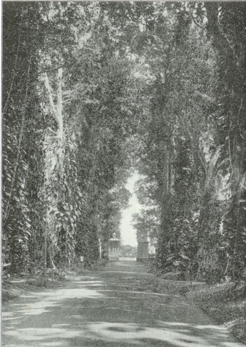
De geheimzinnige laan van Kanarieboomen, waartoe een doorgang tus- schen vier massieve witte pilaren, met vazen bekroond, toegang verleent.

De morgen is de tijd der glanzende gedachten. Daarom heb ik den morgen lief... Zoo moet Frederik van Eeden eens gezegd