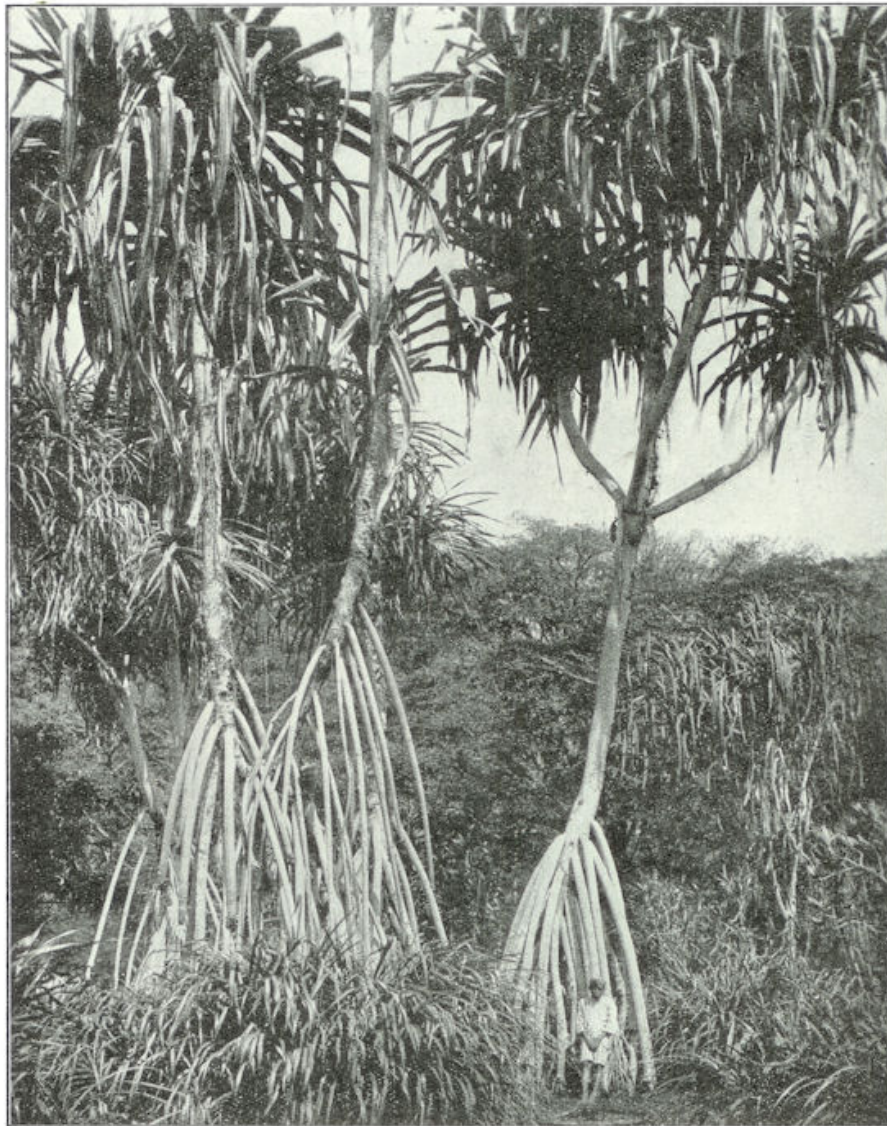
De fijne, treurige Pandanen op de hooge steltwortels. (Ter vergelijking van de grootte lette men op den inlander).

boomen, welker reuzenwortels als breede klauwen, hooger dan een mensch, in de aarde vastgrijpen.