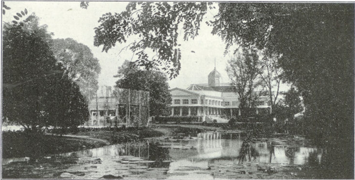
Als in een sprookjestuin uit Duizend en een Nacht weerspiegelt het blanke paleis in den vijver.

den ochtend, wanneer de dampen zijn weggetrokken, zijn de uitzichten klaar, voor dat de luchtkolommen trillen boven de verhitte vlakte.