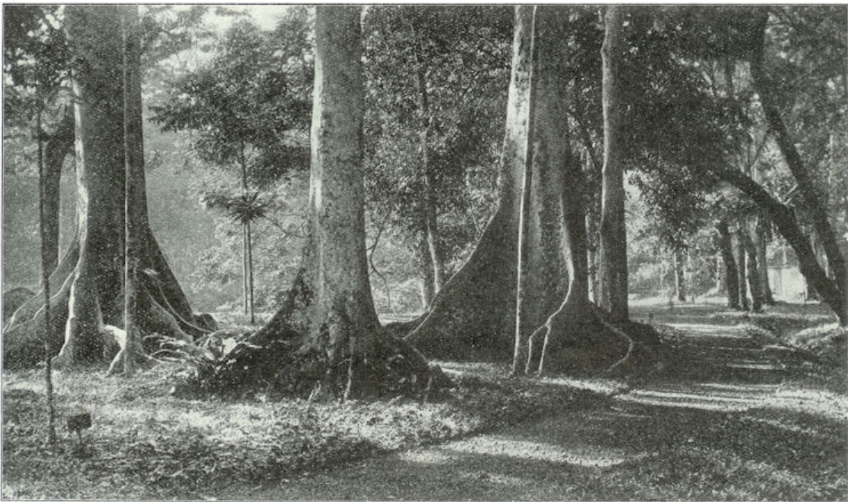
In het zware, donkere en toch liefelijke Ficusbosch. „De schilderachtige, breedstammige boomen, welke reuzenwortels als breede klauwen in de aarde vastgrijpen.

men in het gedempte licht, genieten wij blij en stil van de heerlijke natuur en droomerig staan wij aan den vijver.