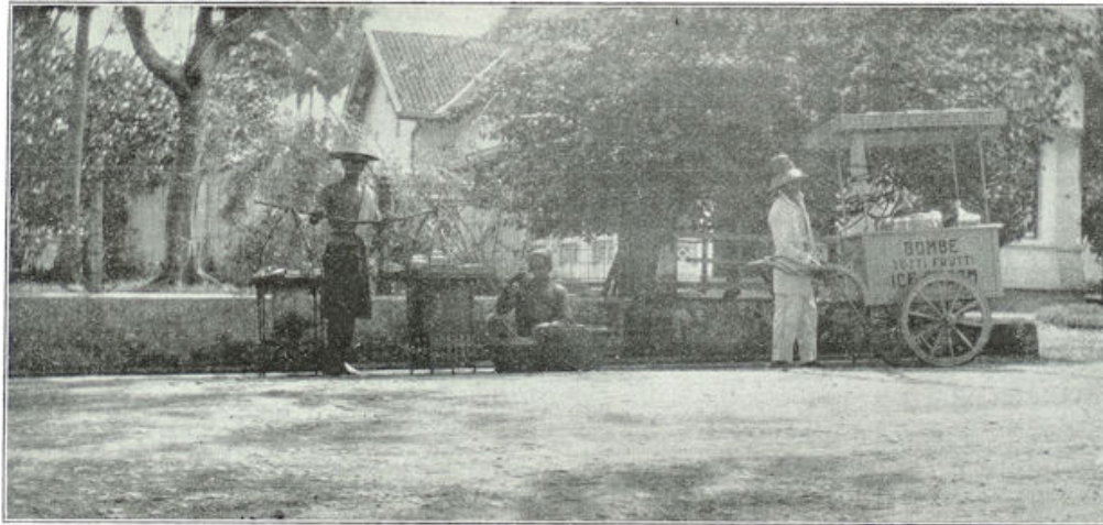
Links een draagbare Inlandsche gaarkeuken. In het midden een koopvrouw. Rechts de Javaan met een ijskarretje.