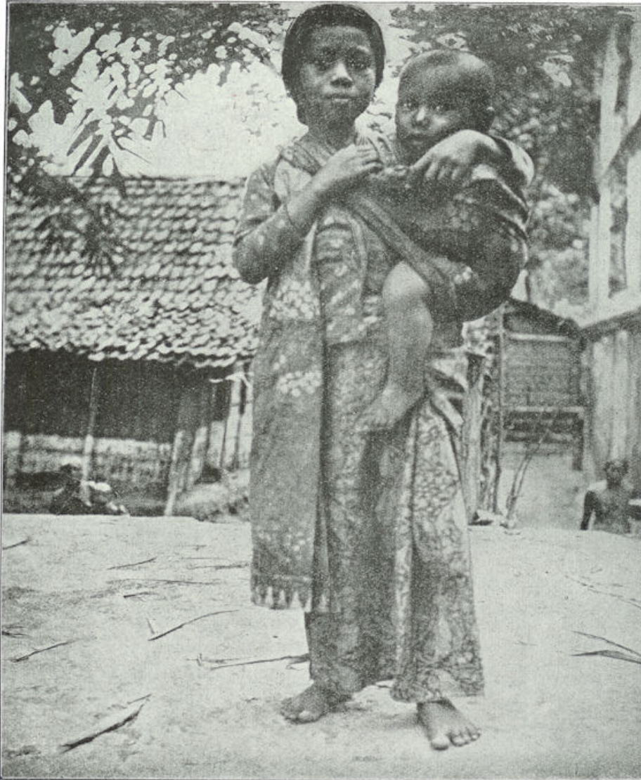
De jonge moeder draagt het kindje op haar zijde in de slendang.

vrouwen en plassende kinderen. De kleurige sarongs worden gewasschen en direct in de Indische zon gedroogd. Opvallend is de keurige zedige wijze, waarop de Javanen zich ontkleeden, wanneer zij baden in de kali. Zulke tafereelen van de wasch aan den rivieroever ziet men overal; telkens weer het fleurige tafereeltje van de vrouwen aan den kalizoom.