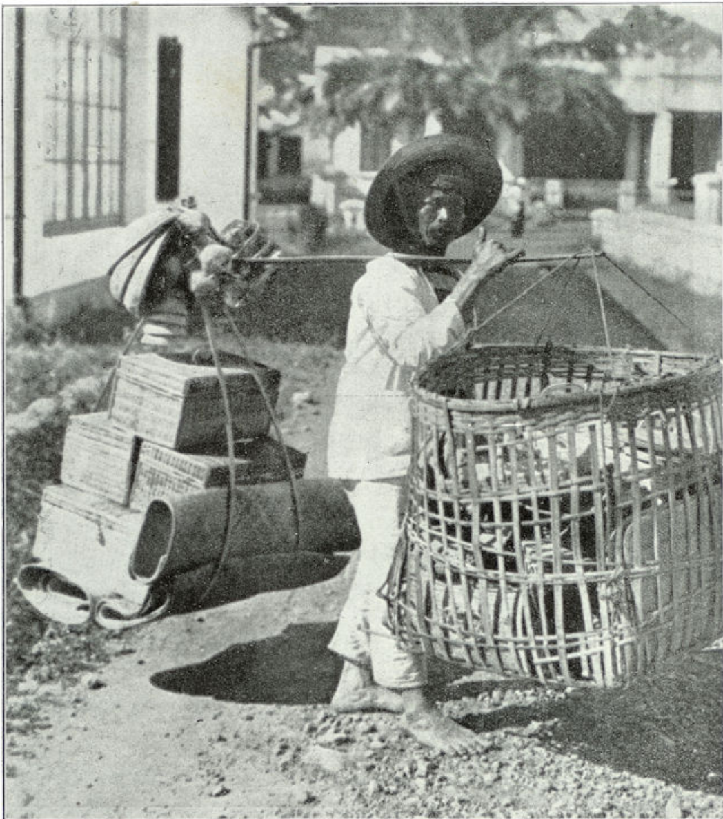
Inlandsche koopman met matten. De klontong heeft de lasten aan een pikolan. In de rechtsche mand zit vlechtwerk (meest door blinden gemaakt). Links op de pikolan saringans (zeven).

wij, maar trippelt, waarbij de draagstok telkens iets doorzwikt — het is, alsof hij het verschijnsel der interferentie weet te benutten! Zoo draagt de waroenghouder zijn verplaatsbare keuken; zoo trippelt de koopman met zijn korven vol kippen; zoo loopt ook de klontong (koopman) met zijn manden vol vlechtwerk, bijv. zeven voor de rijst. Ja, zoo dragen de Javanen zelfs heel groote lasten: het is niets gek als men zoo een piano ziet transporteeren of een telefoonpaal versjouwen. Zoo zagen wij een groep koelies bezig, een lange telegraaf-