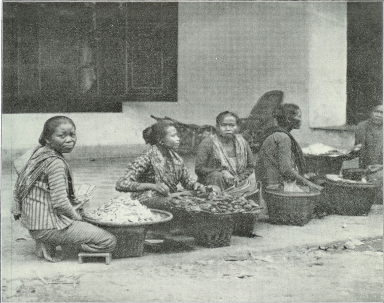
Javaansche vrouwen op de passar. Zij zitten voor het huis, waar het „marktbewijs” wordt afgegeven voor een prijs van één of twee cent.

schouder. Komen zij dan op de passar, dan betalen zij het marktgeld voor hun plaats — en zitten dan geduldig neer bij de uitgestalde waren. En vele kijkers en ook wel koopers flaneeren rustig rond.