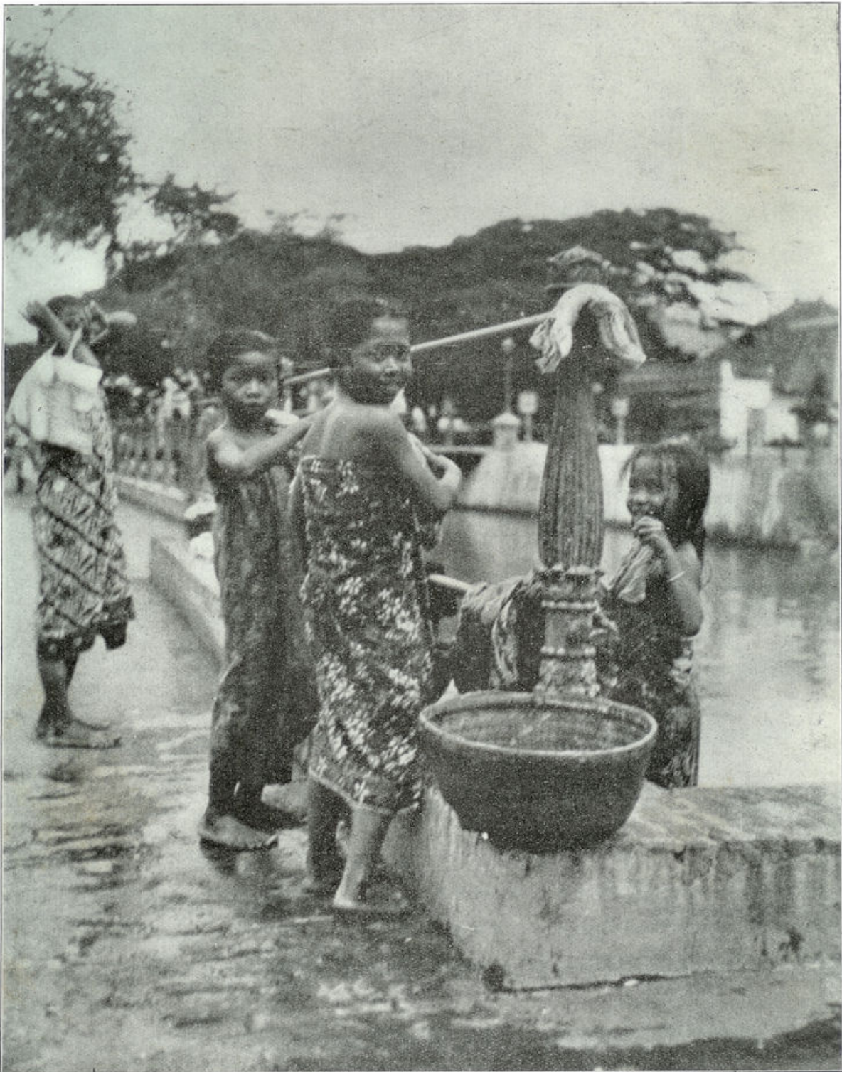
In de grachten van Rijswijk zijn steenen trappen gemetseld, waar den heelen dag Inlandsche vrouwen wasschen en baden.