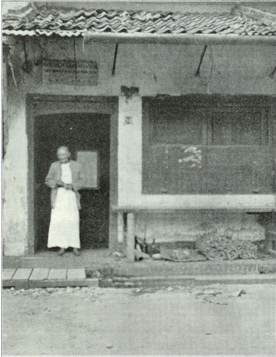
Opiumkit in de Chineesche wijk te Batavia. In de deur de kithouder.

dysenterie hier hun pijn te vergeten. Merkwaardig is het, dat opiumschuivers een zekere vrees hebben voor water; zij wasschen zich weinig en verwaarloozen zoo hun lichaam. Zij