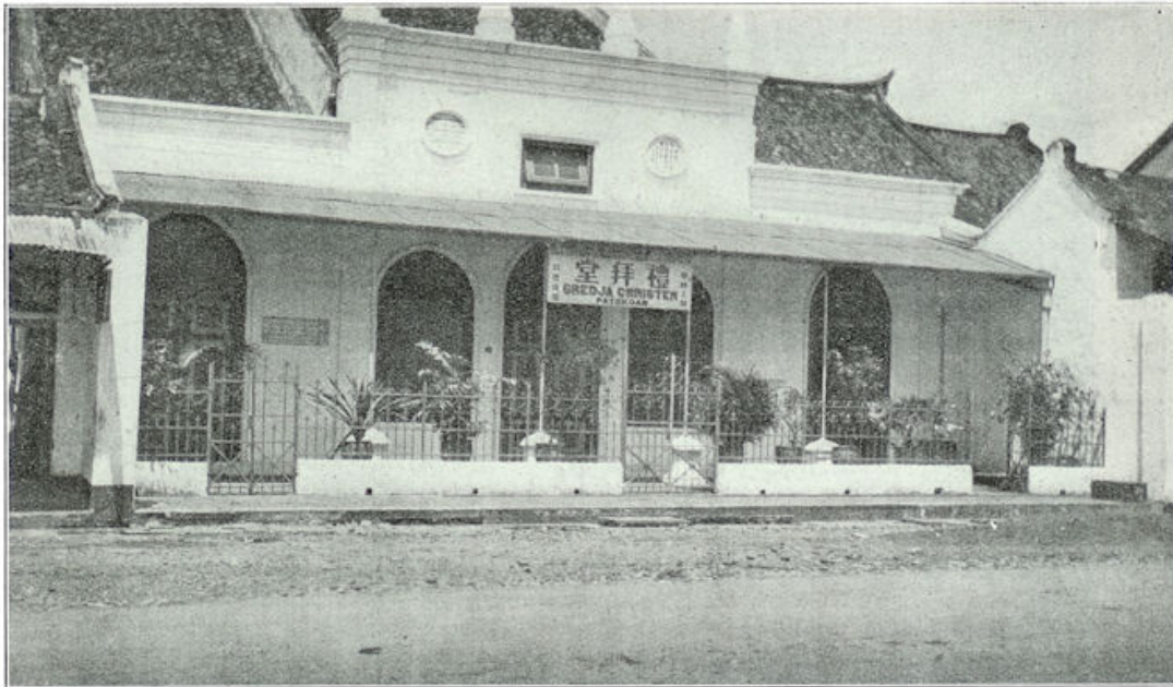
Christelijk-Chinese Kerk in Batavia.

meling van vernuftig uitgedachte smokkelmidelen, bijv. schoenen met helle hakken, dozen met dubbelen bodem; openingen in den tropenhelm.