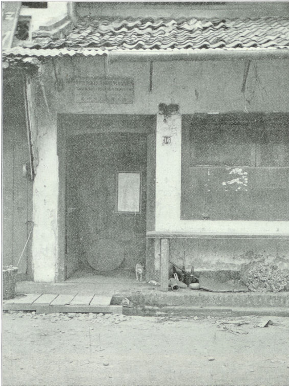
Chineesche Opiumkit. Opschrift boven de deur: Opiumkit voor mannen (in het Nederlandsch, Maleisch, Arabisch en Chineesch).

voordoer, hoe dat schuiven wel toeging. Hij had wel ervaring, want hij verbruikte 25 mata per dag en hij schoof reeds 41 jaren lang! Om alles duidelijk te laten zien, begon hij met het openen