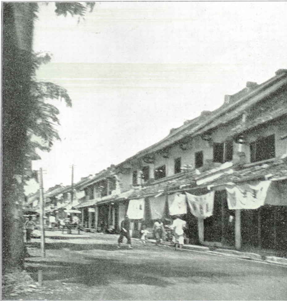
Straat in de Chineesche wijk van Batavia. Alle huizen zijn toko's (winkels).

En nu valt wel sterk op het verschil in aanleg tusschen Oud- en Nieuw Batavia. Want