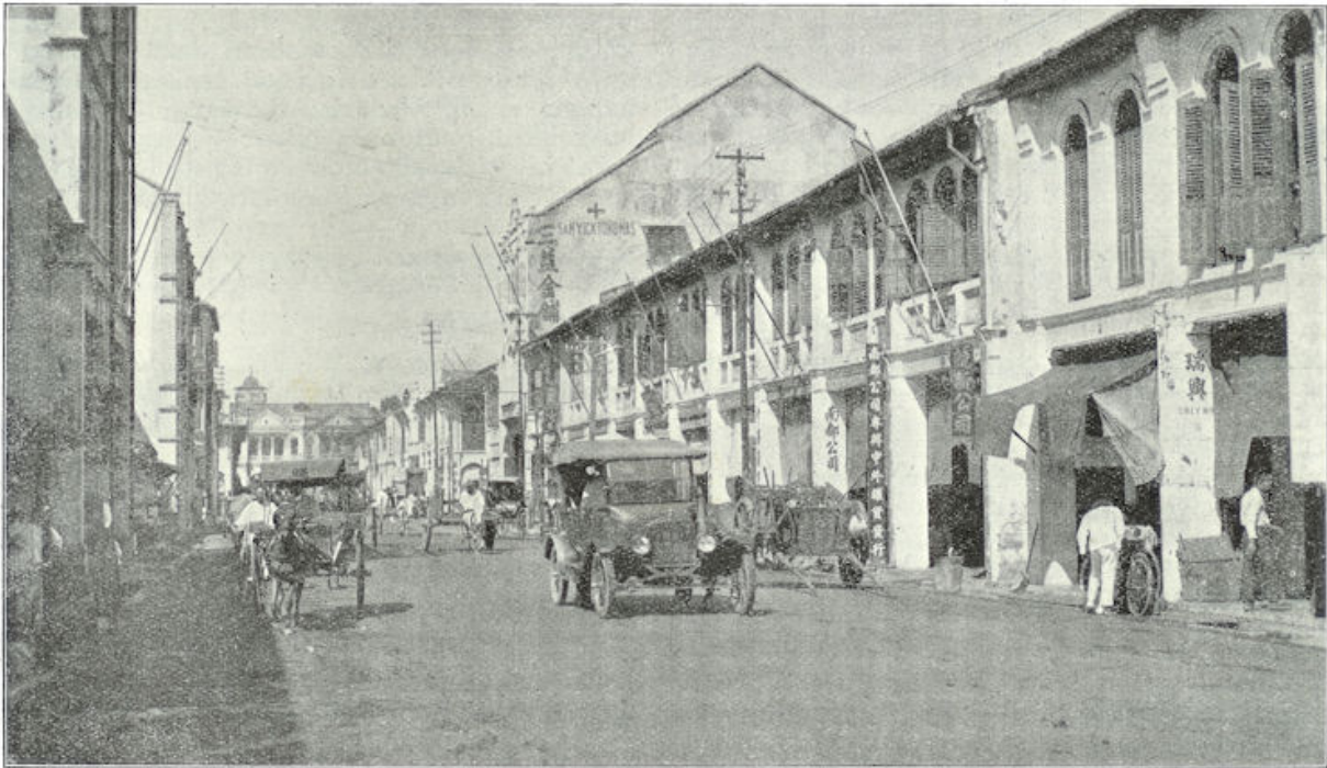
Chineesche toko's in Medan.

zorg wordt besteedt, om de rubber te veredelen — en welk een succes wordt door selectie verkregen!