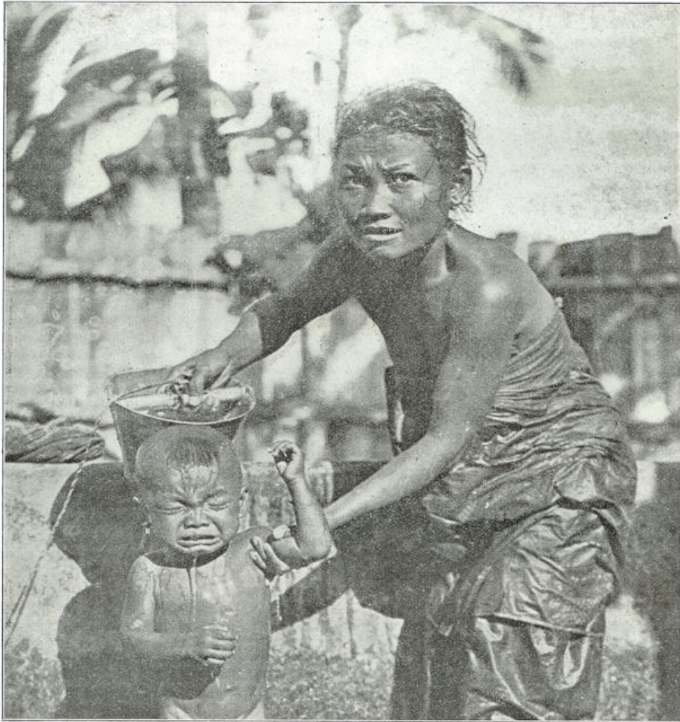
Een vroolijk staaltje van mandiën. En inlandsch jongetje, dat een beurt krijgt.

Zoo vertoont Sumatra's Oostkust een krachtig economisch leven van zoo sterken opbloei, dat Cremer indertijd sprak van ons land van onbegrensde mogelijkheden.