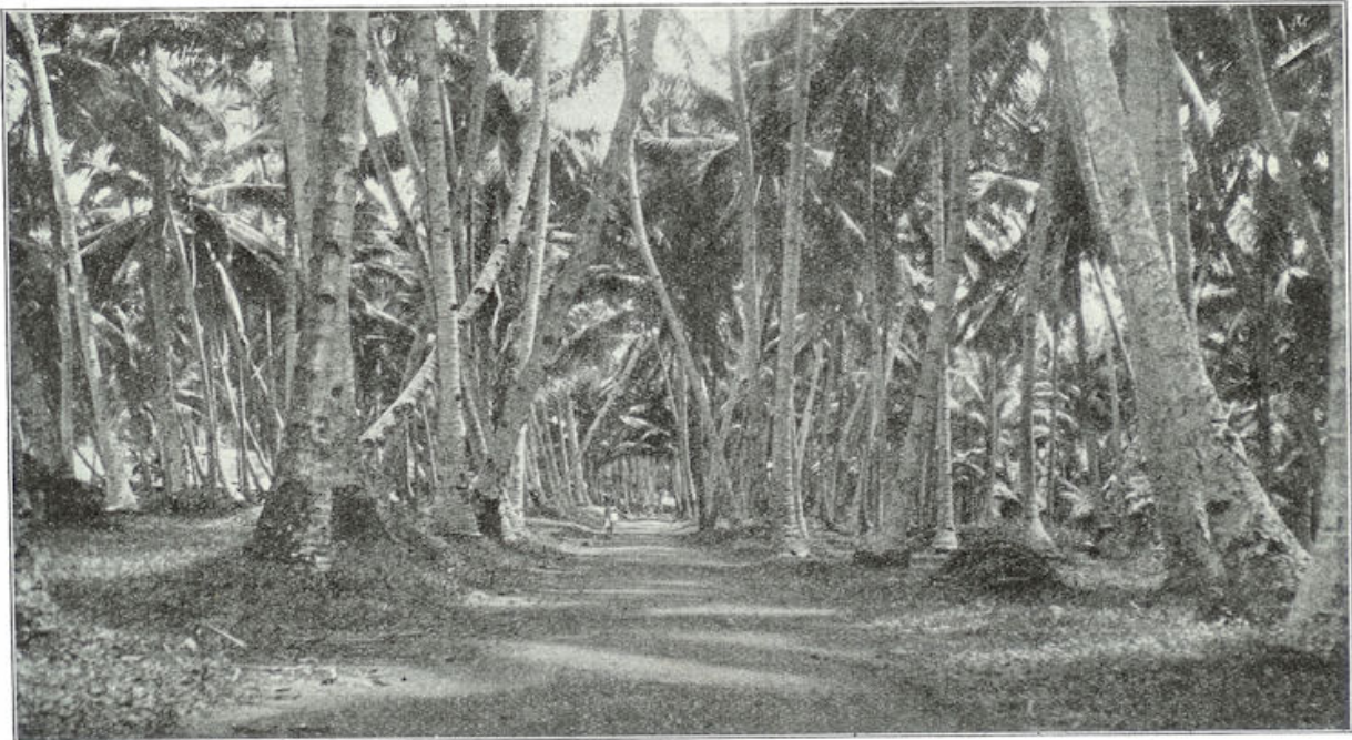
De palmenlaan van Belawan naar Medan.