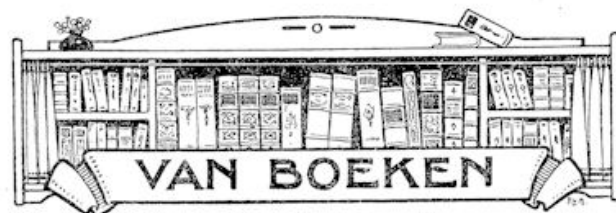
Lichtende Verten door NELLY HAS. Uitgave N. V. Drukkerij Jacob van Campen te Amsterdam.

Toen hij 'n oogenblik later weer aan 't spelen was, hoorde ze hem alleen nog maar — zachtjes als tot zichzelf en met iets van spijt — zeggen: „ik wou maar even gekeken hebben, of er mooie bloemen groeien.”