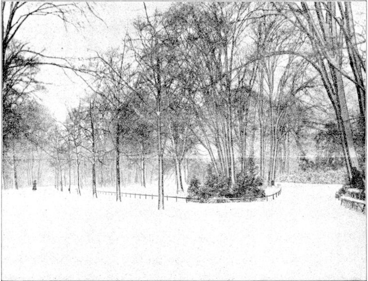
's Winters in het Vondelpark te Amsterdam.

schrijving blijft niets, totaal niets over. En van zulke beschrijvingen is het boek vol.