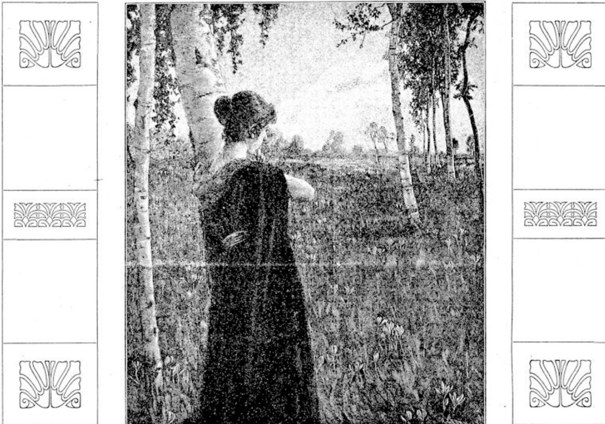
ZOU HIJ KOMEN?

Is daar geen stem, die fluistert van ontrouw en van bedrog?