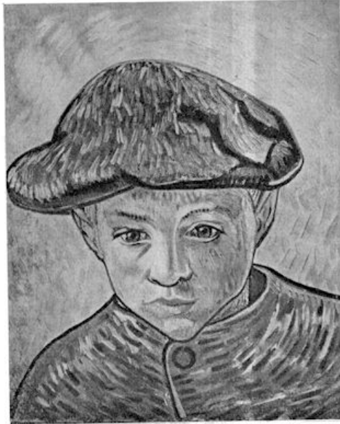
XV. Van Gogh — Jongenskop

Van Gogh echter vervaagt den vorm niet, doch verstelt dien, door er overal donkere lijnen omheen te trekken. En dat doet hij niet alleen bij de groote onderdeelen: muts, kop, jas, maar ook bij de kleinere: oog, neus, knoop.