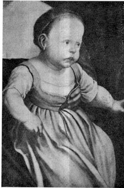
III. Hans Holbein de jonge — Kind op moeders schoot

Dit is een deel van een grooter teekening, waarop moeders ver-