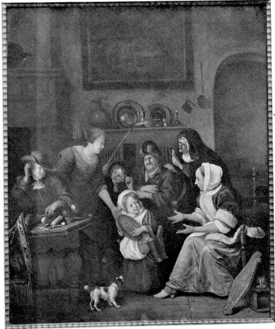
IV. Jan Steen — Sintnicolaasfeest