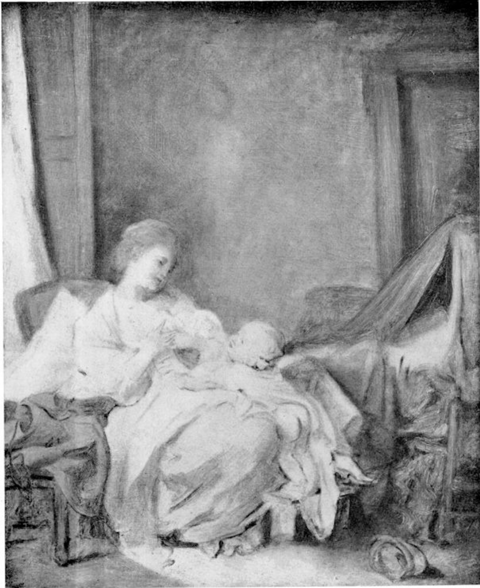
XII. J. B. Greuze — Verboden spijs