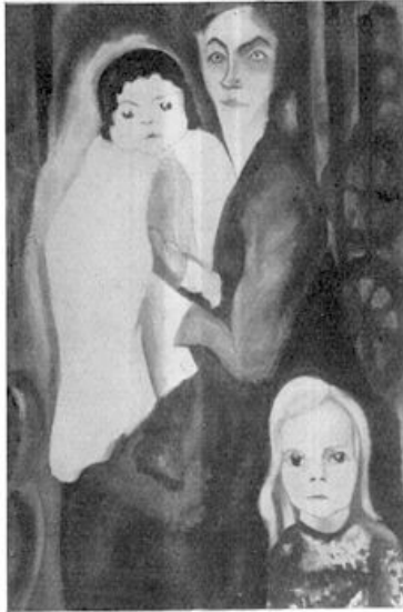
XVI. Charley Toorop — Moeder met kinderen

Tot op zekere hoogte ligt hierin een gedeeltelijk loslaten van de schilderkunst, en een toenadering tot de teekenkunst. En dat het expressionisme deze bijkomstigheid heeft, ziet gij behalve bij Van Gogh, ook zeer duidelijk bij Charley Toorop.