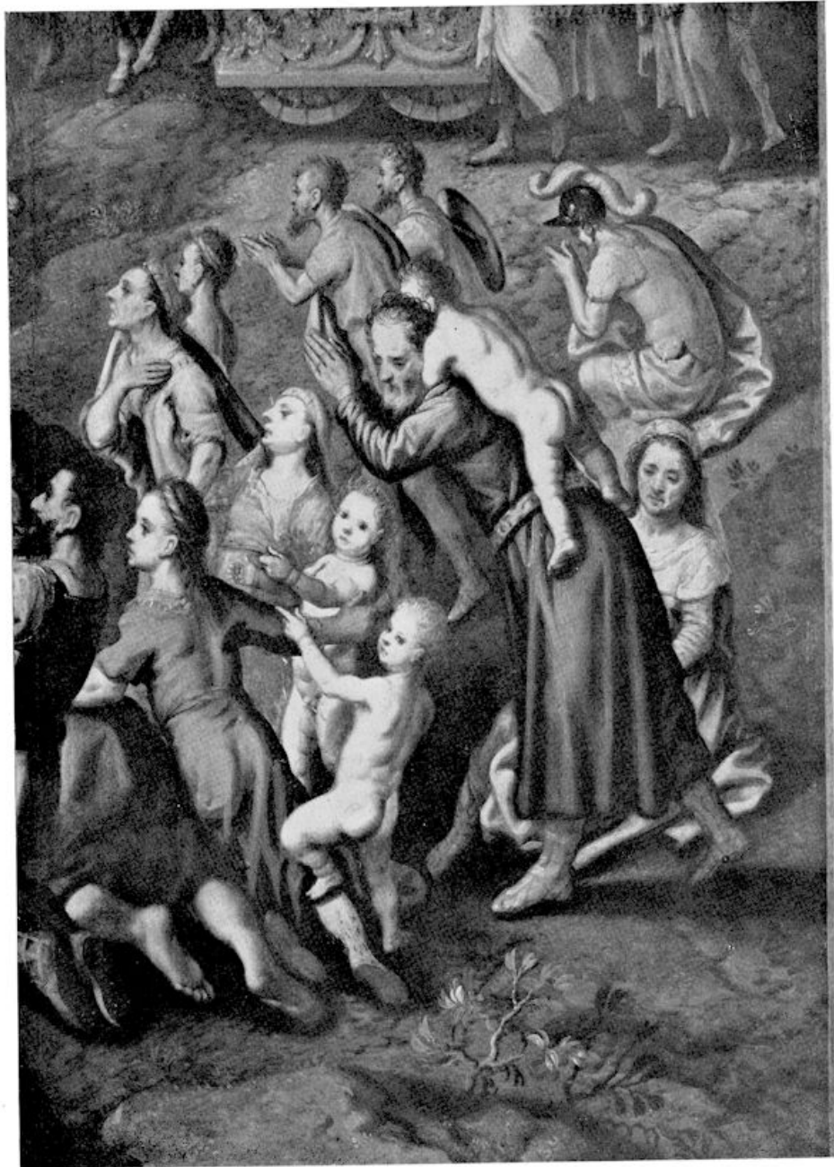
II. Pieter Aertsz. — Deel van het schilderij: „Nebukadnezar”