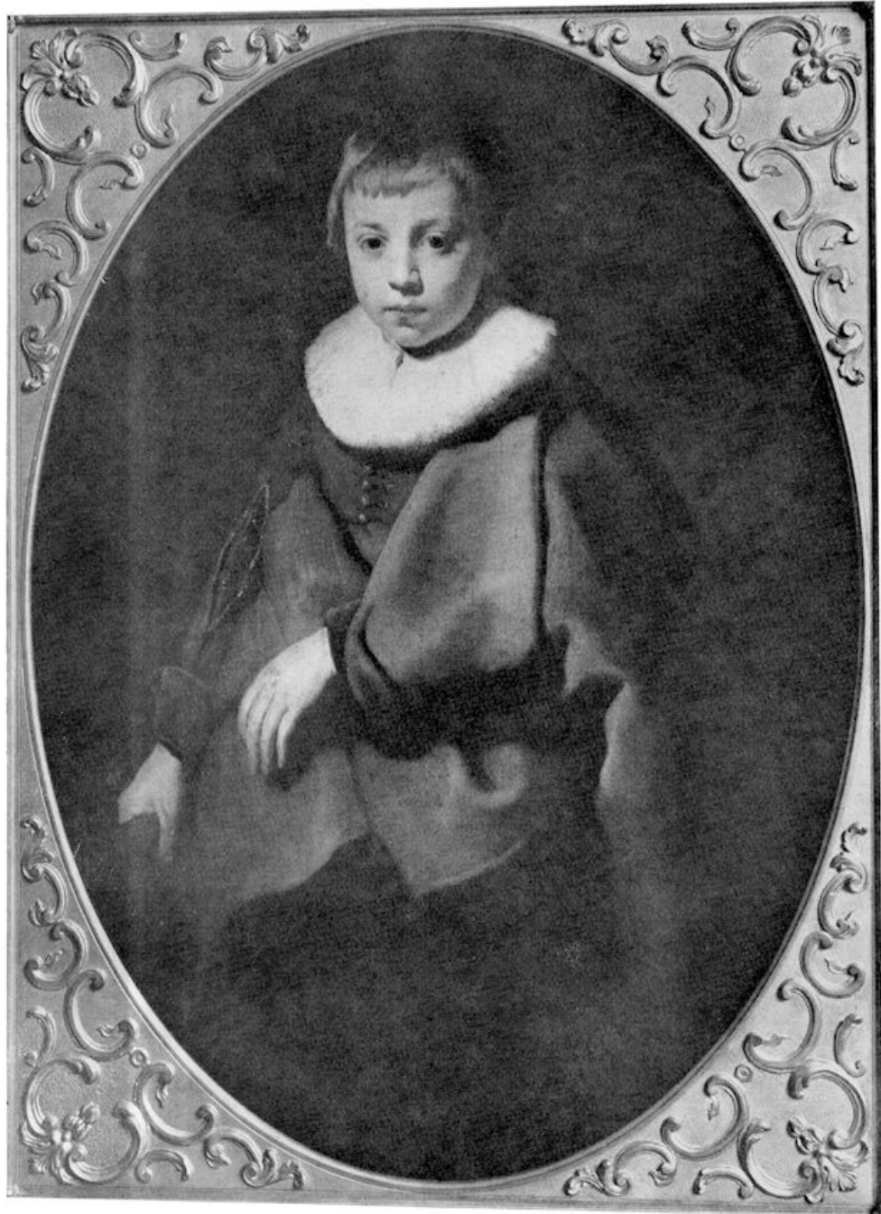
VII. J. A. Backer — „Portret van een jongen man”