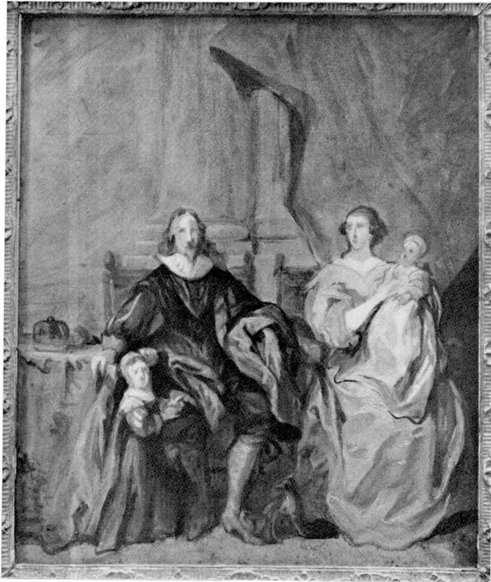
VI. Antoon van Dijck — Schets voor het schilderij: „Het gezin van Karel I”