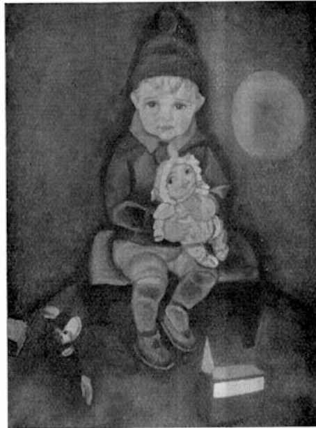
XVII. Jan Sluyters — Kinderportret

maar dan ook zeer verfrisschend voor een iegelijk die zich niet afkeer heeft afgewend van Ovens, Ten Kate en Pieneman.