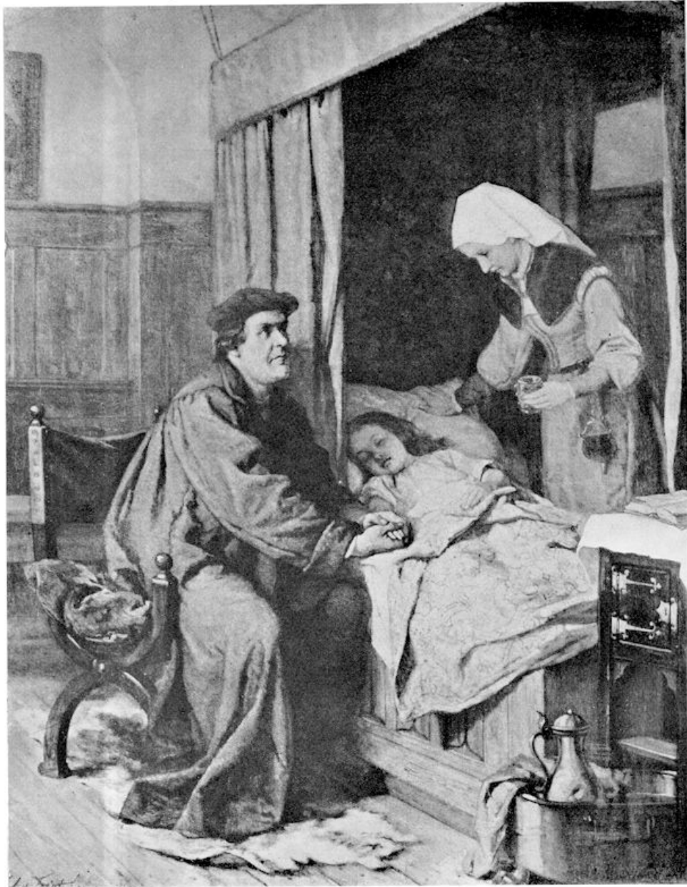
XI. H. A. van Trigt — Luther bij het ziekbed van zijn kind