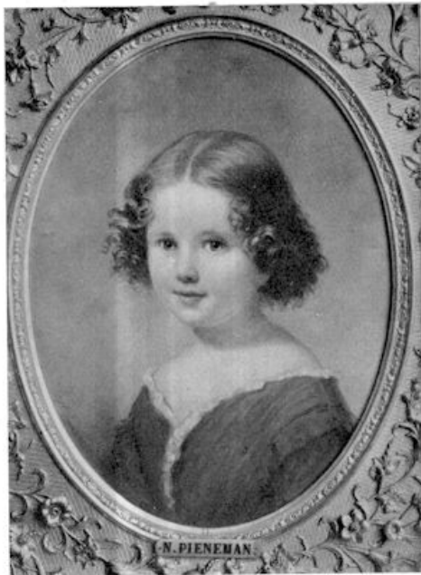
IX. N. Pieneman — Kinderportret

Summa summarum: de korte tijd, waarin men „het kind” kon schilderen, is voorbij; men vindt „het gewone kind” te gewoon, en men streeft er naar, het kind zijn eigen weeë grootmensche-omantiek op te dringen.