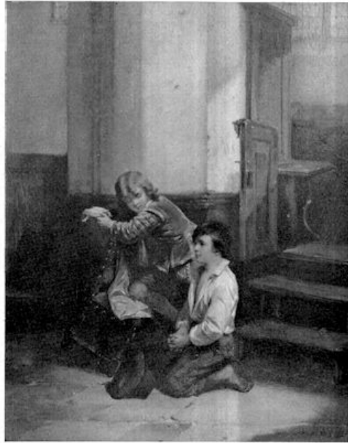
X. H. F. C. ten Kate — In de kerk

Het rijkgekleede jongetje, dat over een stoel, een boek, en ook nog over een op dien stoel hangenden mantel beschikt, voelt zich in die kerk „heel gewoon”. Hij ervaart niets aan of in zijn hart. En hij kijkt dus, — terecht, — een beetje nieuwsgierig naar dat heel „opzichtig” met zijn armoede te kijk loopende arme jongetje, dat daar zoo pathetisch doet en kijkt alsof hij inplaats van in een publiek gebouw, in zijn „binnenkamer” is, en in die binnenkamer in een zéér ongewonen toestand verkeert.