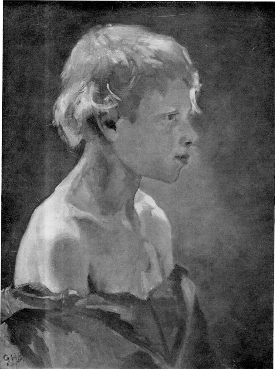
XIV. Breitner — Modelstudie