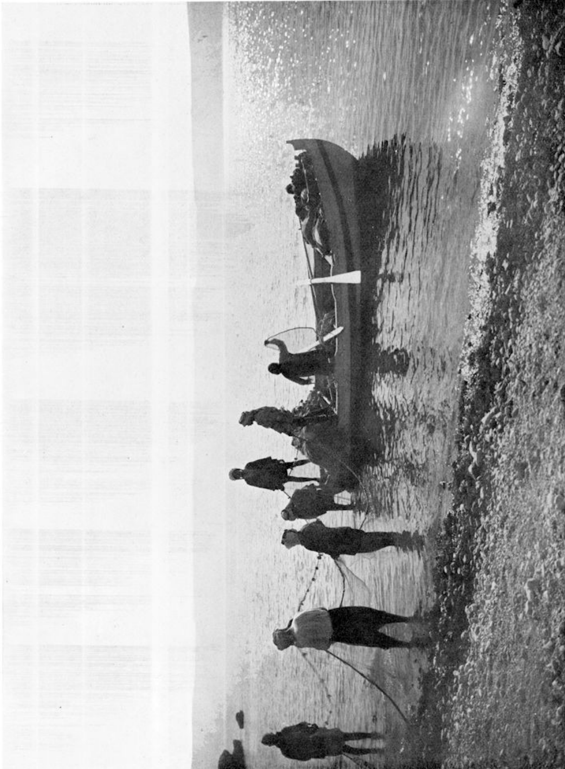
HET UITWERPEN VAN HET NET