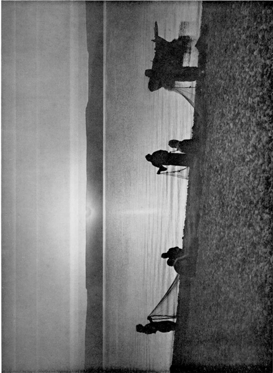
BIJ HET AANBREKEN VAN DEN DAG WORDEN DE NETTEN HERSTELD