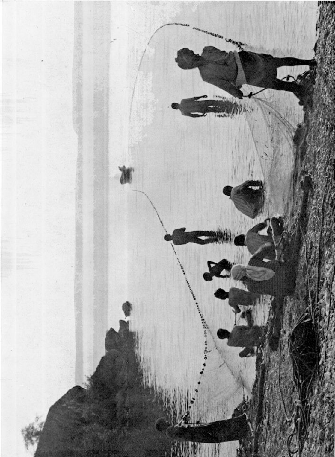
HET NET WORDT GESLEEPT