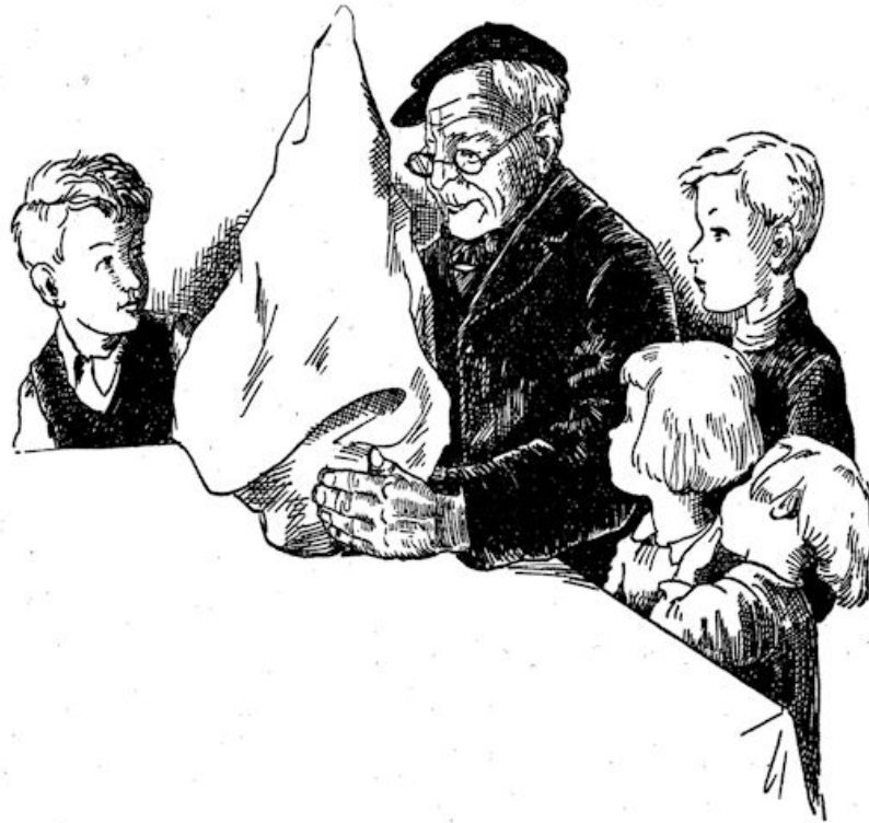
De kinderen stonden er met de neuzen op . . .

En vooruit, ze hadden immers nu al vijf-en-twintig jaar dat boompje gehad : licht, dat nu een  nder er eens van genoot. En ze konden z nder dat boompje immers even goed denken aan . . .