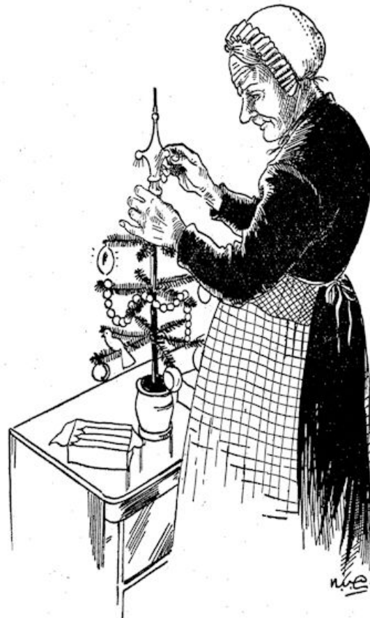
Baje zette de piek er op . . .

Toen werd de boom in een hoekje van de mooie kamer gezet, naast het