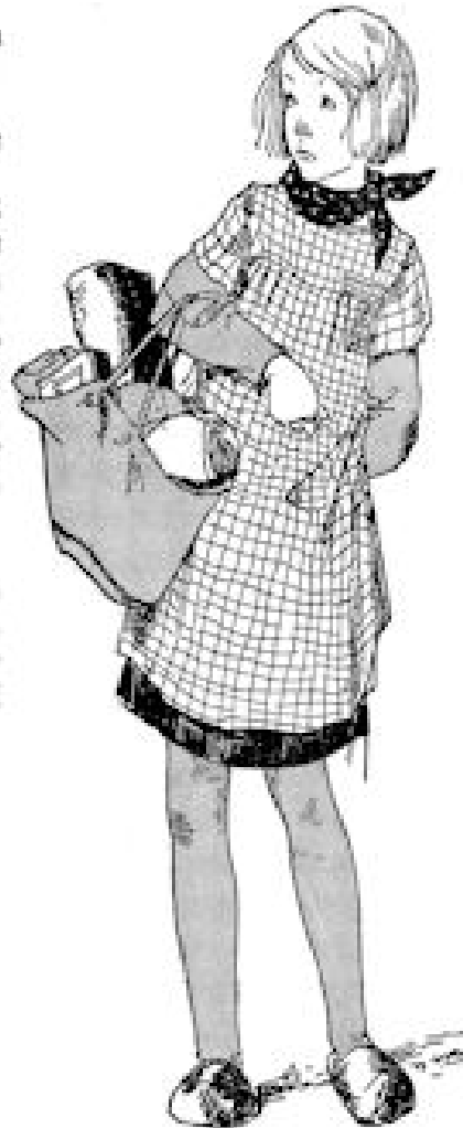
Een zware boodschappentas hing aan haar arm.