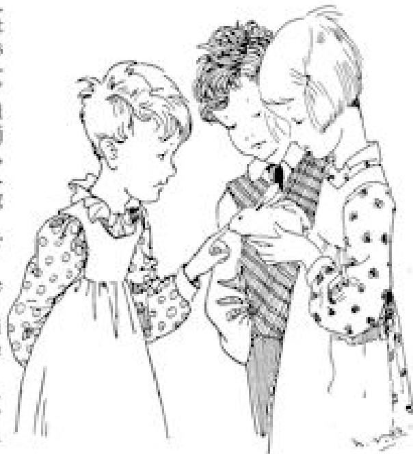
„Wat enig zeg - wat 'n leuk dier!”

Jan was weggegaan van de anderen. Hij wilde niet meer naar het konijntje kijken. Hoe kon Nel dat! Ze was er toch echt blij mee en toch vond ze 't gewoon, dat met Kerstmis . . . . .