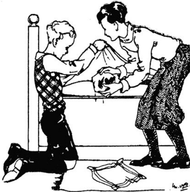
Maar eerst stopten ze de kikkers in hun glazen paleisje onder de wol.

De jongens kregen half versleten prenteboeken te zien en vergaten bij