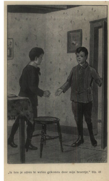
„Ik ben je adres te weten gekomen door mijn broertje,” blz. 41

„Ik ben je adres te weten gekomen door mijn broertje,” zoo begon Frits het gesprek; „zijn vrindje, die je dikwijls bij ons ontmoet heeft, woont hier dicht in de buurt; en hij had je al meermalen in dit huis zien binnegaan. Hij wist niet zeker of je hier woonde, maar ik dacht: ik kan