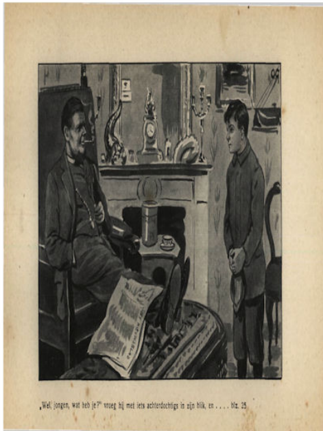
„Wel, jongen, wat heb je?” vroeg hij met iets achterdochtigs in zijn blik, en . . . blz. 25.

oogen staan zoo mat, alsof alle geestkracht haar ontbreekt! Zou niet iemand van de familie haar een poosje kunnen vervangen, dat zij eens rust kan nemen?”