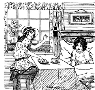
Vier boekjes, zeg, vier!

„Straks krijgen we stíjfel,“ zei Bep, „laten we nou eerst gaan uitzoeken, welk behang we nemen willen.“ Zij bladerde in de boekjes. „Gelukkig, ze zijn allemaal gelijk. Als we 't behang in tweeën