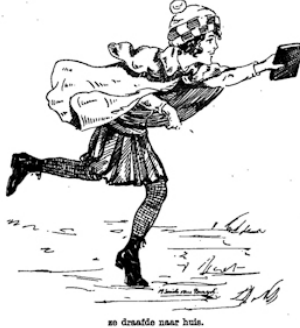
ze draafde naar huis.

Ze liep niet, nee ze draafde naar huis, die Leni,