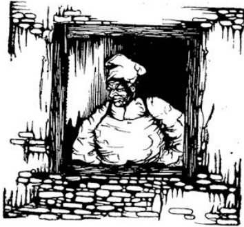
Door het sijaam van de kazerne kijkt de dikke kok.

Als hij zoo staat te denken, schiet hem opeens iets leuks te binnen, tenminste hij geeft zijn witte muts een duw, zoodat hij heelemaal scheef komt te staan en krabt zich eens achter z'n oor.