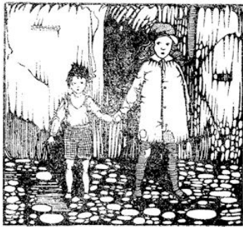
Een nieuw meisje met een klein broertje aan haar hand.

het allebei véél te fijn om naar die prachtige vertellingen te luisteren.